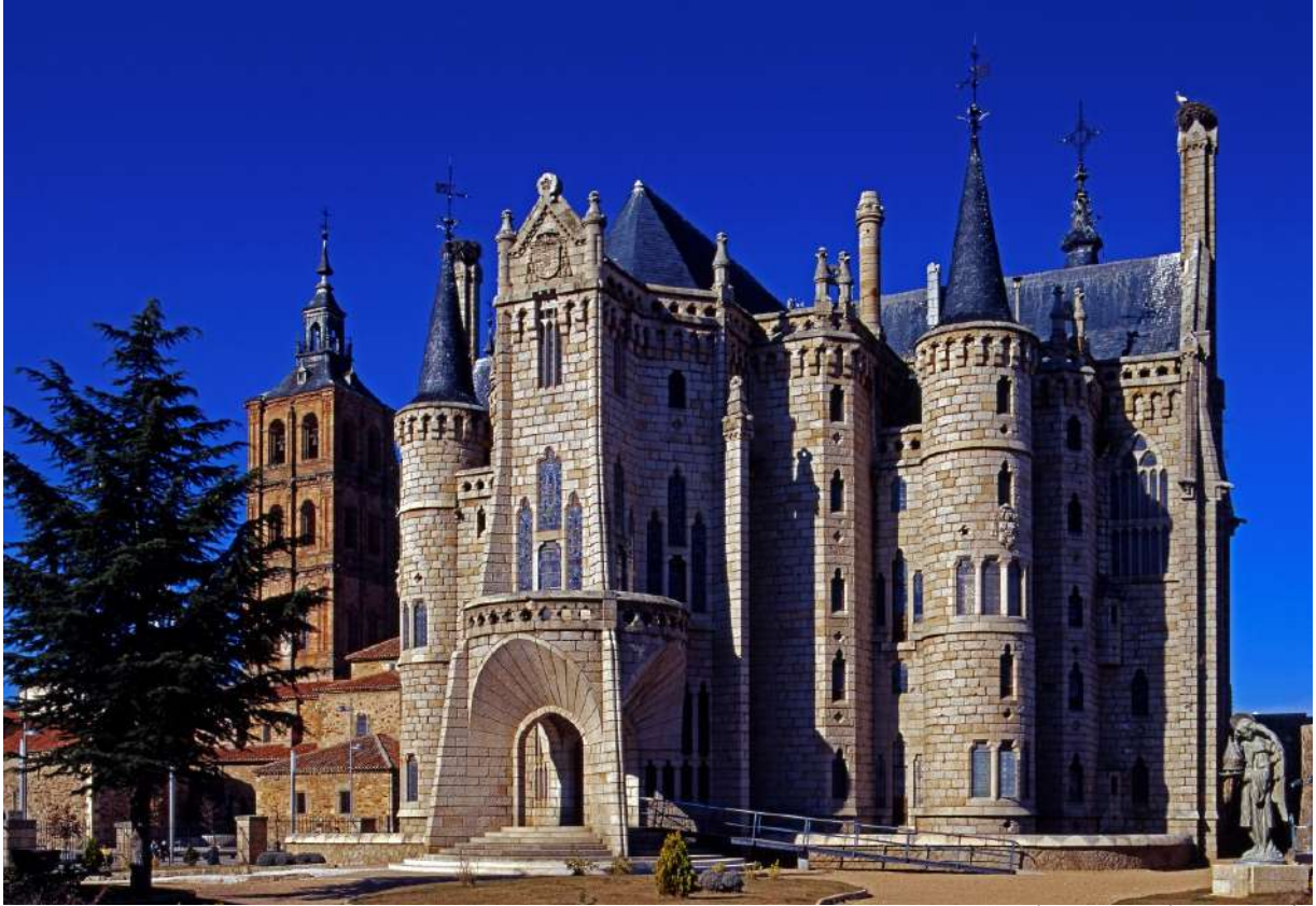
Palacio Episcopal, Astorga, León

Tras la batalla de Bailén, el Rey José abandonó Madrid para refugiarse al Norte del Ebro. Napoleón, herido en su imperial orgullo, reunió un ingente ejército y entró en España el 4 de noviembre de 1808 para restituir a su hermano en el trono: un mes después entraba en Madrid. Pero sus planes de doblegar el resto de la Península se vieron trastocados por la presencia de las tropas británicas del general Moore en Salamanca. Los franceses salieron a su encuentro en pleno invierno al tiempo que los británicos se decidían a retirarse hacia el Noroeste en lo que se conoce como la Carrera del Inglés.