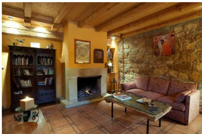
Posada Real La Posada del Pinar, Pozal de Gallinas, Valladolid

Si buscas una experiencia de completa inmersión en la naturaleza y la autenticidad de Castilla y León, te recomendamos las Posadas Reales inuestra marca de calidad dentro del Turismo Rural! No sólo te alojarás en edificios singulares, sino que la excelencia del alojamiento y del trato están garantizadas! Una estancia perfecta para vivir una experiencia inolvidable y sumergirte en todas las actividades, patrimonio y naturaleza de Castilla y León.