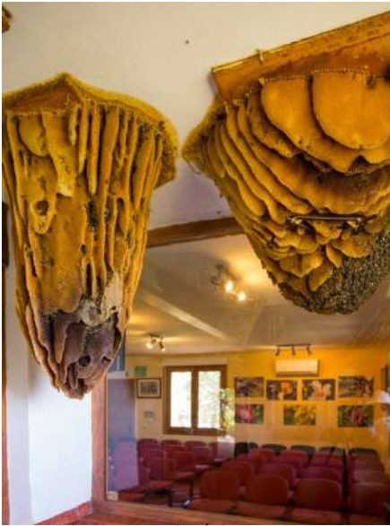
Museo de las abejas, Poyales, Avila

Abejas del Valle es un Aula-Museo creado para la didáctica del mundo de las abejas, en el que se pueden observar con total seguridad a estos laboriosos insectos. Tener la oportunidad de contemplar a las abejas en acción actuando libremente en su medio natural hace que este original museo vivo sea un lugar único e inmejorable en su género. No se trata de un museo cualquiera, es un lugar donde tendréis la posibilidad de desentrañar los misterios de la colmena y su perfecta organización social. Conoceréis de primera mano el fascinante mundo de las abejas, descubriendo cómo viven y trabajan, y su relación con los humanos. Podréis ver colmenas colgantes y a través de imágenes observar a la reina poner huevos, a los zánganos alimentándose y a las obreras recolectando la miel y el polen. Todo esto con las explicaciones de un experto apicultor. Además cuenta con una exposición de material apícola antiguo: colmenas tradicionales de toda la península y Marruecos, extractores, cazaenjambres, mieleras, ahumadores y otros utensilios utilizados para la apicultura.