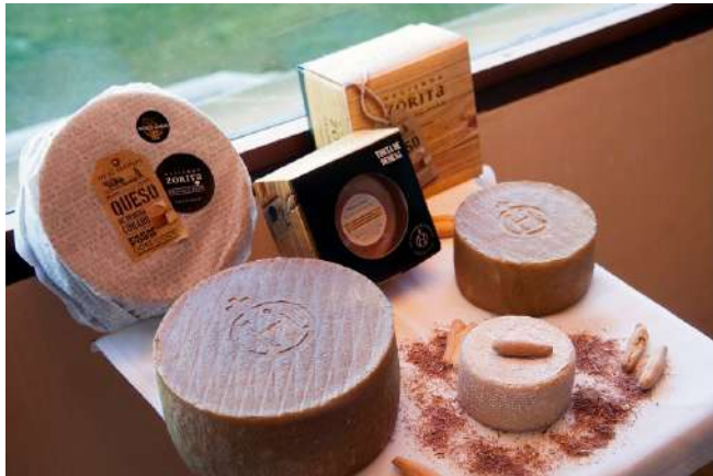
Queso curado de leche de oveja de Hacienda Zorita