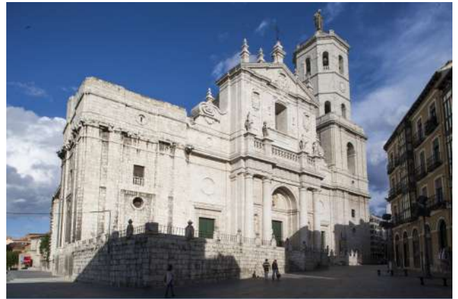
Fachada principal Catedral de Valladolid

Es sin duda una de las joyas de la ciudad de Valladolid, el rey Felipe II, nacido en esta ciudad, no quiso morir sin dejar a su ciudad sin catedral propia, por lo que en 1582 se comenzaron las obras, siendo en 1595 cuando toma rango de catedral, ya que hasta ese momento sólo era Colegiata y dependía de la diócesis de Palencia. En 1597 muere Herrera y en 1598 Felipe II. El proyecto iba a ser muy ambicioso, para llegar a convertirse en una de las catedrales más grandes de la cristiandad, sin embargo, por falta de recursos económicos quedó inacabada. Previamente a la traza renacentista, existieron 3 colegiatas, las dos primeras románica y gótica, de esta última quedan vestigios como la torre pórtico o las salas del actual museo de arte sacro. Existió una torre paralela a la actual, llamada de la Buena Moza por ser la más alta y esbelta del momento, pero una gran tormenta en 1841 hizo que quebrase con lo cual en el siglo XIX se comienza la construcción de la actual, rematada por la figura del Corazón de Jesús en 1923.