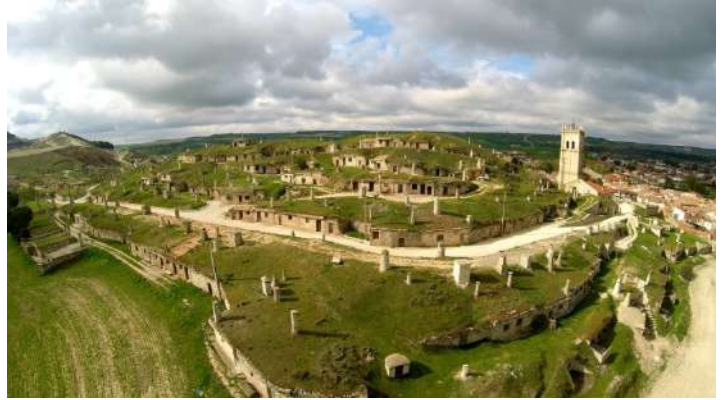
Barrio Bodegas Baltanás, Palencia

Los barrios de bodegas de Torquemada y Baltanás están declarados Bien de Interés Cultural (BIC) de Castilla y León con categoría de conjunto etnológico, como manifestación del patrimonio cultural etnográfico de Castilla y León y asociados a los sistemas productivos del vino. Recorrer estos barrios es entrar en el mundo del vino y de las bodegas tradicionales que había en los pueblos, muchas veces incluso en las propias casas. El conjunto de Baltanás cuenta con 374 bodegas en 6 niveles y el de Torquemada con 465 bodegas censadas. Son zonas con una buena producción de vino que se perdió y que actualmente se ha recuperado, al punto de que muchos de estos vinos ya han logrado importantes premios nacionales e internacionales en distintas categorías. Esta arquitectura tan típica del Cerrato Palentino es un elemento de identidad que comparten casi todos los pueblos de la comarca, que han sabido conservar sus raíces y recursos naturales tradicionales ya desde el siglo XVI tal y como recogen varios escritos. Existen visitas guiadas para conocer de primera mano estos hermosos barrios bodegueros y algunas de sus bodegas. No te lo pierdas y reserva ya tu visita.