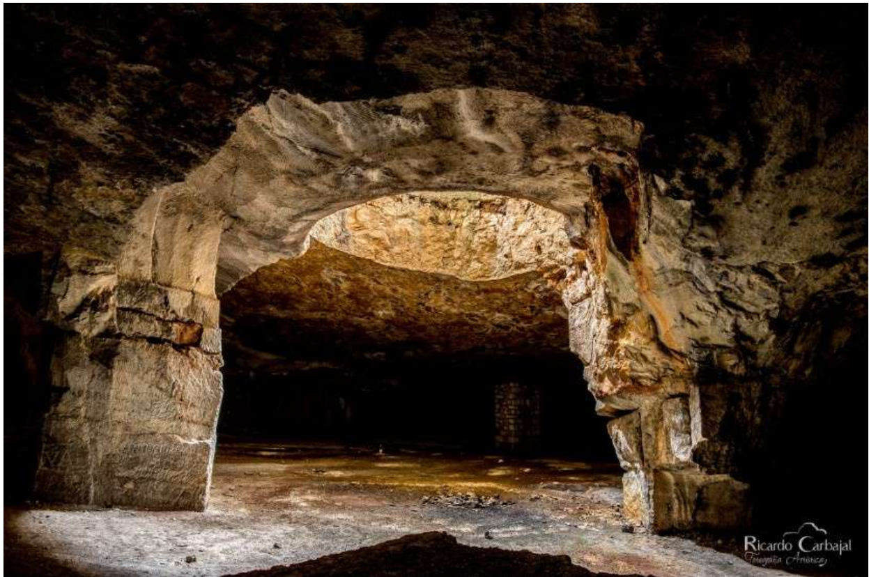
Galería de la Luz, Hontoria de la Cantera, Cubillo del Campo y Tornadijo, Burgos