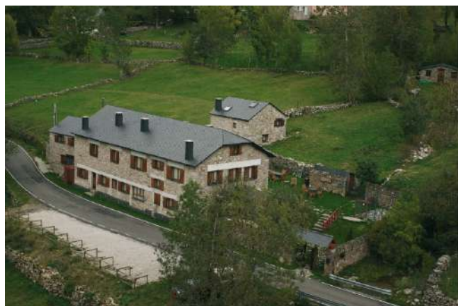
Posada Real El Rincón de Babia, La Cueta, León