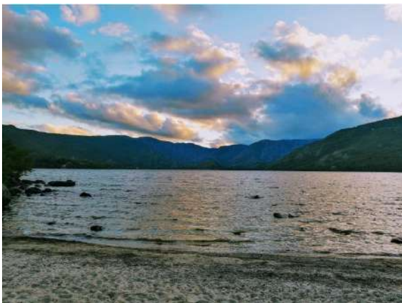
Lago de Sanabria, Zamora

Ya tenemos aquí el verano abrasador, así que este año os proponemos un buen plan. Refrescarnos en las maravillosas playas de interior. Zamora es un lugar ideal pasar el verano. Aunque de día hace calor, las noches son frescas y no le faltan ríos, lagos, lagunas y embalses en los que darse un refrescante baño. Y dentro de la provincia, Sanabria destaca en estas fechas, no solo por su lago sino también por los parajes que lo rodean. En el Lago de Sanabria, a pesar de ser de origen glacial, en los meses de verano la temperatura es agradable, incluso en estos últimos años, cálida. Sus aguas son puras y es fácil ver peces pequeños en la orilla. Para los más aventureros, se pueden practicar actividades acuáticas, como piragüismo, paddel surf, paseos en barca de pedales o un recorrido turístico en el catamarán eólico-solar Helios Cousteau, en la playa de Costa LLago. A lo largo del perímetro del Lago se suceden varias playas fluviales rodeadas de vegetación. Las más famosas son: la Playa Viquiella, la playa Costa LLago, la playa de Arenales de Vigo, el Folgoso. Además de numerosas playas en distintas localidades que atraviesa el río Tera.