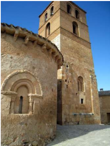
Iglesia de San Miguel, San Esteban de Gormaz, Soria

Villa declarada Conjunto Histórico-Artístico en 1995, conserva abundantes restos romanos y vestigios medievales de iglesias y fortificaciones. El pueblo de San Esteban de Gormaz ocupa una situación estratégica a orillas del río Duero, frontera natural entre las tierras musulmanas y cristianas en tiempos remotos. El castillo, emplazado en la cima de un cerro, domina la aldea y sus bodegas tradicionales, así como algunas de sus calles principales, se disponen en la falda del cerro en acusada pendiente. Hablar de San Esteban de Gormaz es hablar de románico. Alberga la iglesia románica porticada más antigua de Castilla, San Miguel, año 1081. El recorrido por el casco histórico incluye también la románica iglesia de Nuestra Señora del Rivero del siglo XII, la iglesia Parroquial de San Esteban Protomártir, restos del recinto amurallado y calles estrechas y callejuelas en las que se intercala el adobe con la sillería propia de las casas blasonadas. El viajero está invitado a atravesar (a pie, en bici, en moto, a caballo...) su bosque natural por Caminos Tradicionales como La Ruta de la Lana, La Senda del Duero o el Camino del Cid. Aquí también comienza la D.O. Ribera del Duero, viñedos de renombre se extienden a lo largo de las 18 pedanías que forman el municipio.