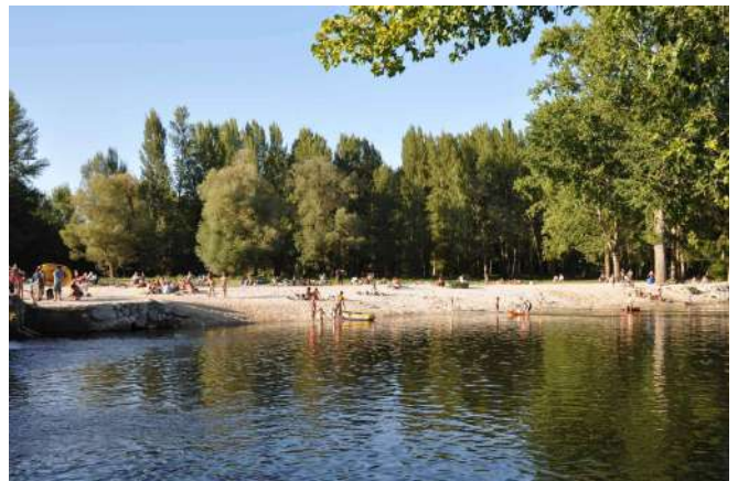
Piscinas Naturales del Nela, Villarcayo, Burgos

La localidad de Villarcayo, situada en la comarca de las Merindades, tiene en el río Nela un recurso muy interesante para disfrutar de la naturaleza a lo largo de todo el año, y especialmente en los meses veraniegos, en que gran cantidad de bañistas se acercan hasta las piscinas naturales del Parque de El Soto, un gran espacio natural con zonas de baño naturales, jardines, zonas verdes, instalaciones infantiles, áreas de descanso. Un espacio perfecto de esparcimiento y recreo. Este año ha pasado a formar parte del censo oficial de Zonas de Aguas de Baño en Castilla y León.