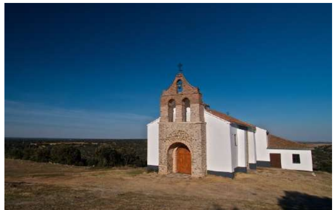
Ermita del Cerro del Castillo Bernardos, Segovia

El yacimiento del Cerro del Castillo está ubicado en la localidad de Bernardos, en el valle del río Eresma, ruta principal entre las importantes ciudades romanas de Coca y Segovia. Allí, encontramos una extraordinaria fortificación de época tardorromana catalogada como Bien de Interés Cultural en 2006. Hacia el siglo V d.C., los hispanorromanos de esta área deciden concentrarse allí por motivos estratégicos. Más adelante se refuerza con la construcción de una potente muralla de piedra, de más de tres metros de anchura y reforzada con torres semicirculares a lo largo de su perímetro. Este lugar sigue siendo habitado en época visigoda y continúa en las primeras etapas de la invasión musulmana, que realizan importantes modificaciones en las murallas. Como apoyo a nuestra visita, existen paneles didácticos de la zona en el Ayuntamiento de Bernardos. A destacar también, la ermita de la Virgen del Castillo. Cada diez años se celebra la subida a la Virgen a la ermita. Otros puntos de interés en torno a esta población serían la iglesia del siglo XVI, la ermita del Humilladero, la ermita de Santa Inés y la de San Roque, esta última con una exposición permanente sobre la historia de la industria textil.