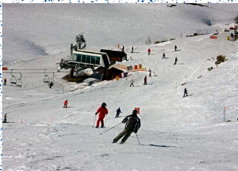
Estación de Esquí de San Isidro, León

En este boletín del mes de diciembre te presentamos algunos lugares de Castilla y León que, seguro, te sorprenderán y en los que podrás disfrutar al máximo de la naturaleza, del arte, de la gastronomía y del ocio... de una manera segura y saludable.