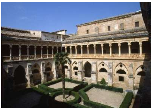
Claustro Santa María de Huerta, Soria