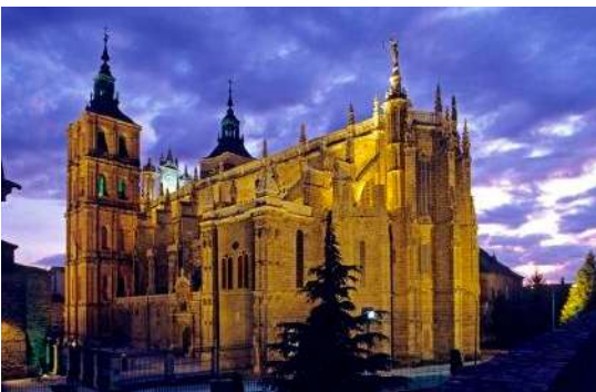
Catedral de Astorga, León