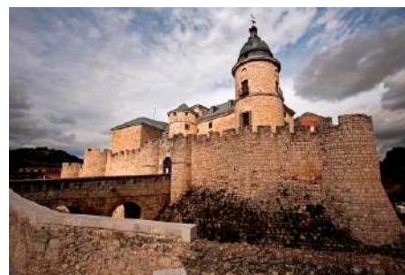
Castillo de Simancas, Valladolid

Valladolid cuenta con muchos castillos de todas las épocas y estilos, un gran catálogo de fortalezas, distribuidas por toda la provincia, muchas restauradas y destinadas a usos, como museos, hoteles, o industrias. Te proponemos que conozcas, el Castillo mudéjar de la Mota en Medina del Campo, que fue el hogar de la Reina Isabel la Católica en la última etapa de su vida. El Castillo de Peñafiel, convertido en museo del vino. El Castillo de Simancas, convertido en Archivo General, el Castillo de Fuensaldaña, antigua sede de las Cortes de Castilla y León, el Castillo encantado de Trigueros del Valle, el Castillo de Íscar, hoy una industria cervecera, el de Curiel, convertido en hotel, y muchos otros como Portillo, Montealegre, Tiedra, Torrelatón, Encinas, Villafuerte, Urueña, Villalba de los Alcores, etc. Una fantástica propuesta para toda la familia.