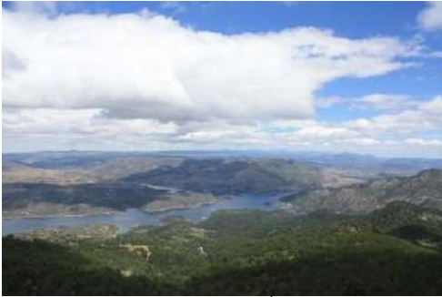
Embalse del Burguillo. Valle de Iruelas, Ávila