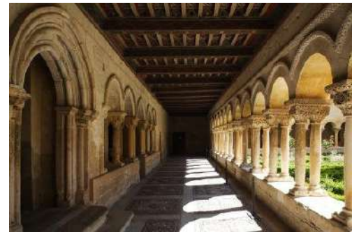
Monasterio de Santo Domingo de Silos, Burgos.

Te proponemos conocer una de las zonas con más historia de la provincia de Burgos: la comarca del Arlanza. Aquí encontrarás villas llenas de encanto, como Covarrubias o Santo Domingo de Silos, entre otras. En Santo Domingo de Silos te invitamos a visitar su monasterio benedictino con un magnífico claustro, una joya del románico europeo, y en la milenaria villa de Covarrubias, recorrer su trazado urbano de estilo medieval, para descubrir la elegante puerta de la muralla, la Colegiata de San Cosme y San Damián, el Torreón de Fernán González, sin olvidar la estatua que recuerda a la princesa Kristina de Noruega a su paso por la villa en el siglo XIII. Te recomendamos acercarte al cercano y espectacular desfiladero de la Yecla, para hacer una pequeña ruta de impresionante belleza, sobre una serie de pasarelas con un recorrido de 600 metros sobre pozas y cascadas. Junto a la espectacular garganta podrás ver también uno de los sabinos mejor conservados del orbe.