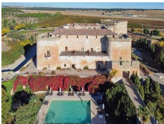
Posada Real Castillo del Buen Amor

Si buscas una experiencia de completa inmersión en la naturaleza y la autenticidad de Castilla y León, te recomendamos las Posadas Reales ¡nuestra marca de calidad dentro del Turismo Rural!. Te alojarás en excelentes alojamientos en lugares singulares, con un fantástico servicio al cliente. Una estancia perfecta para vivir una experiencia inolvidable y sumergirte en todas las actividades, patrimonio y naturaleza de Castilla y León.