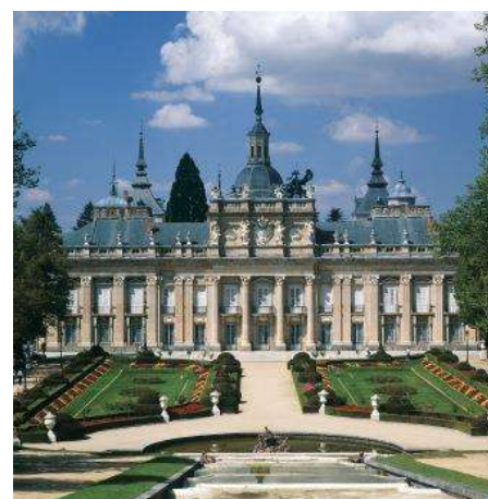
Jardines y fuentes La Granja, Segovia

En Segovia este mes te proponemos conocer el Real Sitio de San Ildefonso. A poco más de 10 kilómetros de Segovia capital se encuentra este lugar que estamos seguros que te sorprenderá. Te proponemos realizar la visita al Palacio Real, un bellissimo ejemplo de la arquitectura palatina europea, donde podrás admirar el salón del trono, la sala japonesa, la galería de las estatuas o la casa de las damas, donde se encuentra el Museo de Tapices. Otra experiencia inolvidable será dar un tranquilo paseo por los jardines, para admirar sus monumentales fuentes. Pero esta localidad tiene mucho más que ver. No te puedes perder la Real Fábrica de Cristales, un ejemplo de la arquitectura industrial del siglo XVIII, en la que podrás conocer los métodos y procesos para la fabricación del vidrio. No abandones el Real Sitio sin antes haber paseado por sus calles.