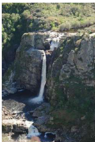
Pozo de Los Humos, Salamanca