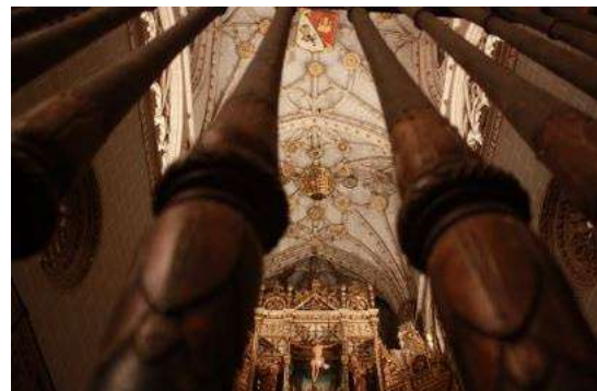
Catedral de San Antolín, Palencia

Visitar Palencia es descansar de la vorágine del día a día, adentrarse en el relax de pasear tranquilamente disfrutando un rico patrimonio artístico, natural y gastronómico. Podrás visitar la Catedral popularmente llamada la "Bella Desconocida". Una de las más grandes de España y guarda en su interior auténticos tesoros de los más grandes maestros. De origen visigodo S.VII, recorre diversos estilos artísticos hasta nuestros días. Este próximo año 2021 se celebra su VII centenario del inicio de su construcción, por lo que es un momento extraordinario para venir a conocerla y participar en los muchos actos que se van a llevar a cabo durante este año. Si estás pensando venir en breve recuerda que el día 1 de enero se celebra una preciosa fiesta dedicada al Bautizo del Niño Jesús, declarada de Interés Turístico Nacional. Se trata de un acto religioso organizado por la Cofradía del Dulce Nombre del Niño Jesús, cuya fundación data del siglo XVI.