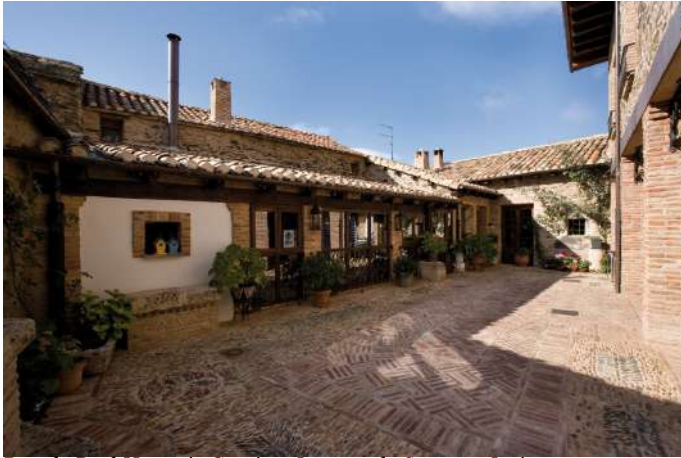
Posada Real Hosteria Camino, Luyego de Somoza, León

Si buscas una experiencia de completa inmersión en la naturaleza y la autenticidad de Castilla y León, te recomendamos las Posadas Reales inuestra marca de calidad dentro del Turismo Rural! No sólo te alojarás en edificios singulares, sino que la excelencia del alojamiento y del trato están garantizadas! Una estancia perfecta para vivir una experiencia inolvidable y sumergirte en todas las actividades, patrimonio y naturaleza de Castilla y León.