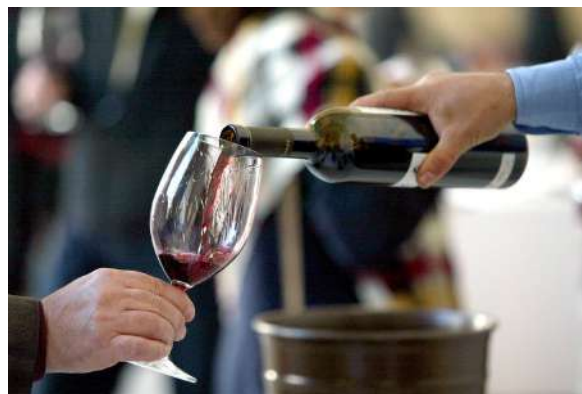
El vino en Valladolid

Valladolid, con V de vino, cuenta con varias Denominaciones de Origen: Ribera del Duero, Cigales, Toro, Rueda y León. A lo largo de todas las bodegas visitables, podrás catar sus vinos, aprender sobre su historia y descubrir su proceso de elaboración. Valladolid es un destino ideal para los amantes del vino y el enoturismo. Por su exquisita gastronomía local y su rica tradición vinícola. Por otro lado tres bodegas de la provincia de Valladolid son DOP Vino de Pago. La Denominación de Origen Protegida Vino de Pago es la máxima calificación que puede obtener una bodega en España. La primera en ostentar esta certificación en Castilla y León fue "Herencia de Uruña" en el 2021. Se ubica junto a las murallas de Uruña, conocida como 'La villa del libro'. En el 2022 se otorgó esta distinción a "Dehesa Peñalba" en la comarca de tierra de pinares y a "Abadía Retuerta" en el valle del río Duero.