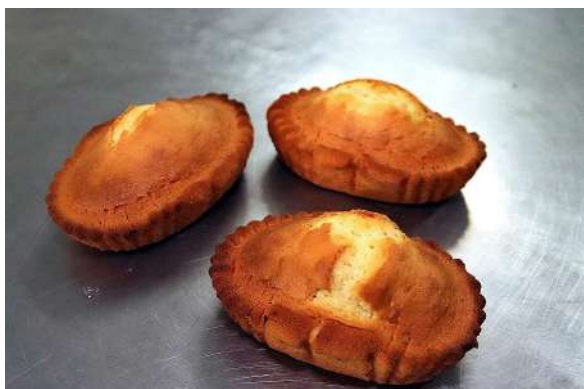
Rebojo zamorano