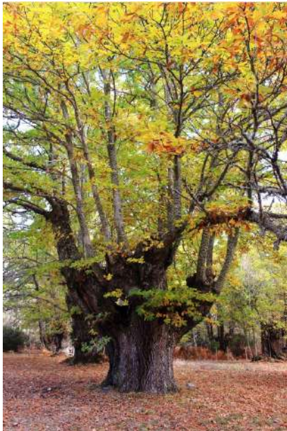
Ruta de los Castaños Centenarios, Salamanca