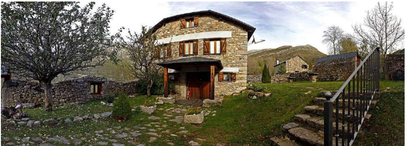
Posada Real el Rincon de Babia, La Cueta, León