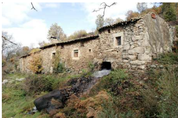
Molino del Tío Alberto en Ávila

A lo largo del río Corneja fueron construidos diversos molinos harineros, entre los cuales cabe destacar el Molino del Tío Alberto. Enclavado en el término municipal de Villafranca de la Sierra, es uno de los mejores exponentes que podemos encontrar de un molino de agua en la actualidad. Su visita es una estupenda manera de conocer modos de vida del pasado. Especial mención merece el paisaje que le rodea, de una belleza asombrosa, el cual dejó reflejado en su obra el pintor Benjamín Palencia que estableció en sus proximidades su residencia. Este conjunto harinero está constituido por una serie de antiguas construcciones adosadas en torno al molino y es un ejemplo de industria molinera característica del aprovechamiento hidráulico del río. Una de estas edificaciones adyacentes es la vivienda, donde vivía el molinero y su familia. Este molino de cubo junto con la vivienda integrada en él, más la cacera, el cárcavo y el resto de las instalaciones componen un magnífico conjunto de arquitectura popular. El agua se toma del río y se conduce mediante caceras que van a parar al cubo donde la presión y la velocidad de la corriente alcanzan los valores óptimos para mover la maquinaria del molino, saliendo finalmente a través de un cárcavo adintelado en una bellísima cascada que devuelve las aguas al río.