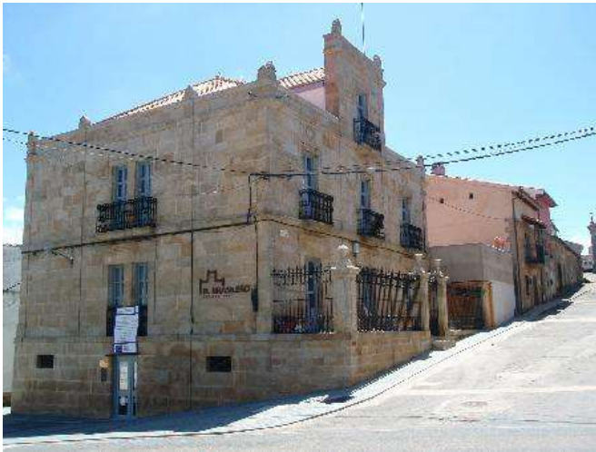
Posada Real Casa del Brasileiro, Saucelle, Salamanca