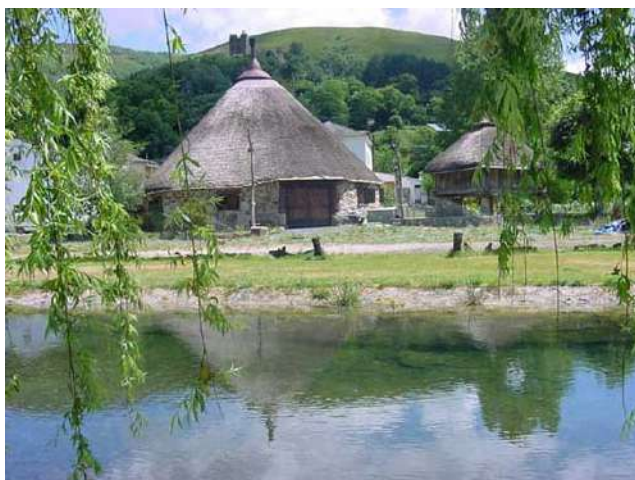
Palloza de Balboa, León

Balboa es un municipio ubicado en el corazón de la Sierra de Ancares, que es uno de los parajes naturales más famosos de León. En el corazón del valle homónimo se encuentran los restos de un castillo cuya primera referencia documental data del siglo XIII, si bien, según la comunidad científica, es mucho más antiguo. En él, se celebra cada junio (alrededor del día 20, ya que varía cada año) desde hace décadas el solsticio de verano. Tanto es así, que la celebración de la "Noche Mágica" ha sido declarada Fiesta de Interés Turístico de Castilla y León. El evento cuenta con un programa de festividades muy variado, que tiene como eje vertebral la música. Además de la actuación artística-musical, su programa incluye "cenas ancestrales", así como diversos talleres culturales, históricos y musicales. Es una festividad alegre, colorida y tradicional.