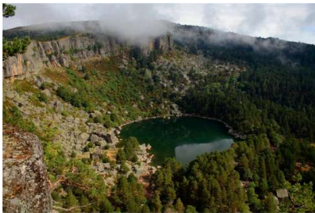
Laguna Negra, Urbión, Soria