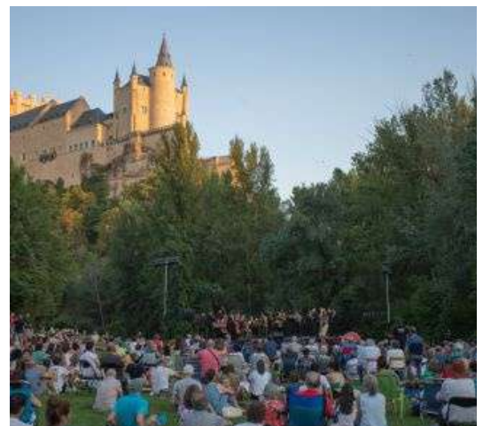
Museg Pradera San Marcos, Segovia

La Fundación Don Juan de Borbón, creada en 1996, es una entidad que promueve el desarrollo cultural de ciudad y la provincia de Segovia. Una de las actividades más importantes, es el "Museg" (antiguo "Festival Internacional de Segovia"). Este festival se celebra desde hace casi medio siglo, y es uno de los festivales de artes escénicas más antiguos de España, con una amplia proyección nacional e internacional. La calidad de su programación junto a los espacios histórico-artísticos donde se llevan a cabo éstas, es un sello de identidad personal del mismo. Por él han pasado artistas de la talla de Teresa Berganza, Monserrat Caballé, la "London Symphony Orchestra" o Rostropóvich. Se divide en tres partes fundamentales: la Semana de Música de Cámara (obras de carácter profesional y de gran nivel, en espacios cerrados), el Festival Abierto (también ofrecidas por profesionales pero en espacios abiertos con un encanto especial) y el Festival Joven (estudiantes que destacan por su calidad). Cita obligada en el mes de julio, si nos gusta la música y las artes escénicas, pudiendo disfrutar además de espacios inigualables que nos ofrecen las tierras segovianas.