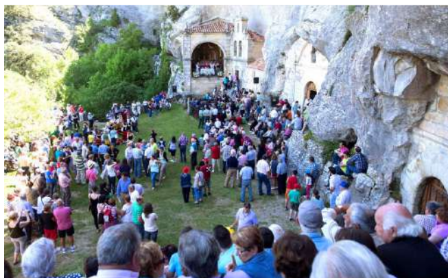
Romería de San Bernabé en Merindad de Sotocueva, Burgos

El Monumento Natural de Ojo Guareña, uno de los marcos paisajísticos más sobresalientes de la provincia de Burgos, las gentes de la Merindad de Sotocueva, el sábado siguiente al 11 de junio, celebran su singular romería en la curiosísima ermita rupestre de San Bernabé. La fiesta, declarada de Interés Turístico de Castilla y León, comienza alrededor de la encina sagrada, donde antaño los regidores de la Merindad celebraban sus reuniones. Allí firman las autoridades en los libros de honor y se elige al Carbonero Mayor. Luego, junto a la ermita-cueva, se celebra la Misa campera, a la que asisten gran cantidad de personas, y al finalizar, grupos de folclore tradicional realizan diferentes bailes para el deleite de los asistentes. Los romeros, llegados de los más variados lugares, degustan sus viandas en las campas cercanas y por la tarde continúa la fiesta con música popular así como concursos varios.