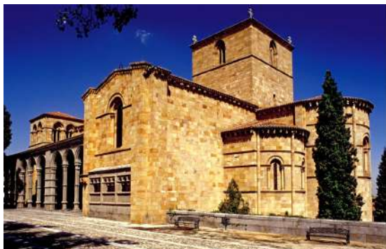
Basílica de San Vicente, Ávila

Uno de los monumentos emblema de Ávila, el cual es de visita obligada para cualquier persona que se acerque a nuestra bella ciudad es la Basílica de San Vicente. Situada en extramuros y construida en granito "caleño", fue levantada en honor de los santos mártires Vicente, Sabina y Cristeta en el lugar donde la tradición señala que fueron martirizados y enterrados. Ostentó la condición de iglesia juradera y se erige como uno de los mayores exponentes de la arquitectura y escultura de los períodos románico y gótico. Destaca por su magnífico pórtico formado por arcos de medio punto, el monumental portal gótico que sirve de paso de entrada, sus capillas distinguiéndose los capiteles historiados de la capilla mayor, la cornisa meridional y sus portadas de Poniente y Sur. En el interior, sobresale el impresionante cenotafio en el que se relata la detención, condena y martirio de los santos. La Capilla central, bajo el presbiterio alberga la imagen de la Virgen de la Soterraña, patrona de Ávila.