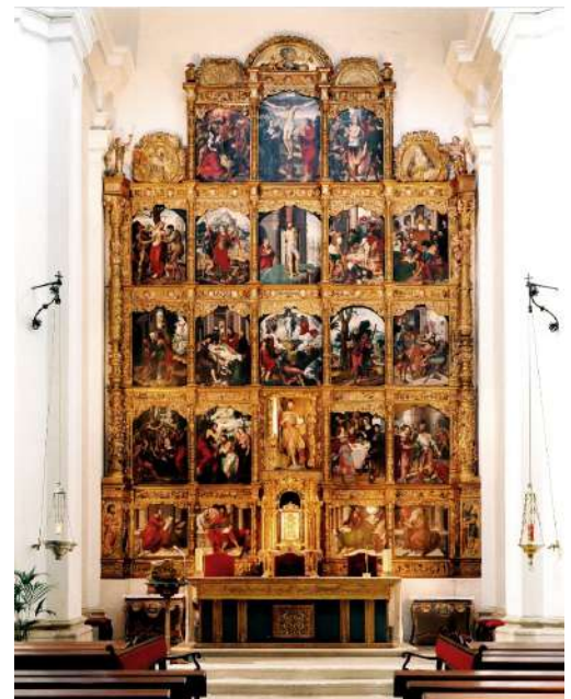
Retablo Iglesia de Carbonero el Mayor, Segovia (Cedida Prodestur Segovia)

Situado al oeste de la provincia, debe su nombre a la fabricación en él de carbón vegetal (leña quemada por combustión incompleta) y más tarde se le añade "El Mayor", para distinguirlo de otros cercanos como "Carbonero de Ahusín". Dentro de sus lugares a disfrutar podemos encontrar, la iglesia de San Juan Bautista, ermitas de San Miguel de Quintanas y Santa Águeda, la iglesia de Ntra. Sra. de la Asunción, el Palacio del Sello del siglo XV de estilo isabelino y la ermita de Ntra. Sra. del Bostar, donde tienen lugar sus dos romerías; una, el sábado anterior al domingo de Pentecostés y, la "Fiesta Grande", en septiembre. Pero sin duda, la joya de Carbonero es su retablo del siglo XVI. Situado en el altar mayor de la iglesia de San Juan con veintiuna tablas con influencias flamencas e italianas, es considerada una obra del taller de Ambrosio Benson y uno de los mejores retablos del renacimiento en Castilla. No dejéis de visitar la plaza, donde podemos apreciar un árbol de origen oriental, un "ginkgo biloba". Si vais en otoño, podréis distinguirlo fácilmente por su amarillo intenso. Y por supuesto, disfrutar de su gastronomía; jamón, chorizo y una exquisita repostería casera.