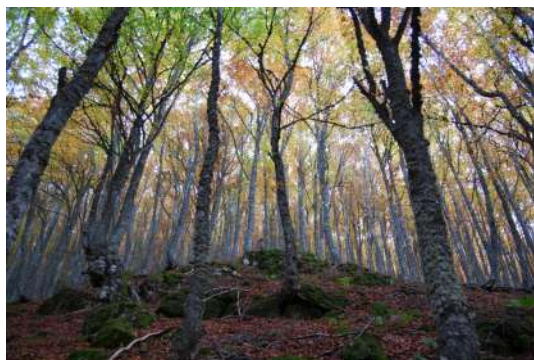
Hayedo de Cofiñal, León

En la Montaña Central Leonesa son numerosos los hayedos que durante el otoño nos maravillan con un amplio abanico de colores. Sin duda, el más conocido es el Faedo de Ciñera de Gordón, un paseo sencillo al que se accede en apenas dos kilómetros y tiene un total de seis, con un haya centenaria conocida como "Fagus" que hace que sea un bosque mágico. En los valles de Gordón también podemos recorrer los hayedos de La Boyariza, entre las localidades de Geras y Carbonera, un itinerario impresionante y bien señalado que recorre parte de la margen izquierda del río Casares. En dirección hacia Vegacervera, en el municipio de Matallana de Torío, el hayedo de Orzonaga nos ofrece una ruta sencilla y con excelentes ejemplares a lo largo del camino. Muy cerca, en Valporquero, junto a la conocida cueva que nos ofrece una visión onírica del mundo kárstico, parte un recorrido fácil y con poco desnivel que desemboca en otro hayedo. Continuando hacia el norte, en el municipio de Cármenes, encontramos un hayedo que parte de la localidad de Canseco en dirección a Pontedo, con un itinerario de aproximadamente ocho kilómetros, en la cuenca del río Torío. Por último, en Llamazares, lugar próximo a las cuevas de Coribos, llegamos al último de los hayedos, el de Bodón, además del colorido que nos ofrece el bosque, la montaña nos impresiona con sus espectaculares paisajes.