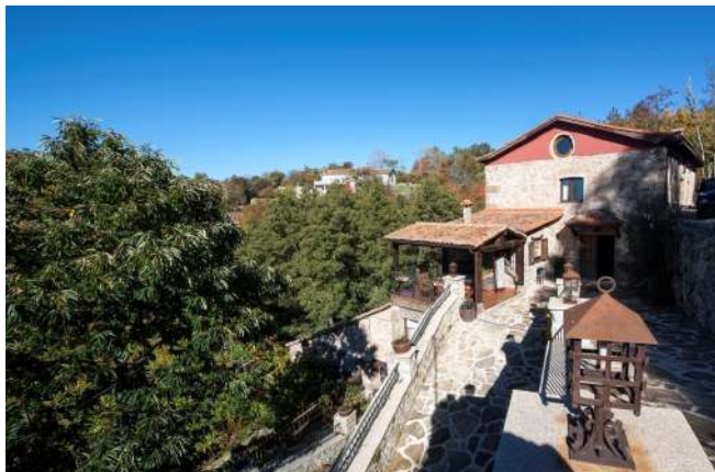
Posada Real Rural Musical, Puerto de Béjar, Salamanca