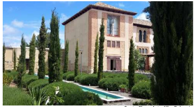
Santa Clara, Astudillo, Palencia

Se construye el convento de Santa Clara en el siglo XIV-XV. Fue una fundación de D a María de Padilla. Es uno de los conjuntos de estilo mudéjar más impresionantes de la provincia de Palencia en el cual destaca su fachada principal y las yeserías de este mismo estilo que decoran gran parte del monasterio. Esta declarado Monumento Nacional desde 1931 y Bien de Interés Cultural desde 2005. Es un convento de monjas de clausura pero se puede visitar gran parte de sus estancias como la magnífica iglesia gótico-mudéjar, el coro-panteón, el torreón, el patio con la alberca o el precioso y amplio museo (que tiene además una preciosa colección de casi 2000 belenes del mundo) cubierto de bellos alfarjes, y que se corresponde con la parte de lo que fuera el antiguo Palacio del Rey Pedro I (para unos el Cruel, para otros el Justiciero). En definitiva una magnífica visita que para ser completa debe terminar con la compra de los sabrosos dulces artesanales que elaboran las monjas, y que son una "delicia celestial". Horario invierno: Martes a Domingo: 11:00-13:00 y 16:30-18:30 (Navidad consultar). Misas: Domingo y festivos: 09:00, diario: 08:30. Entrada general 4€, reducida 2€, gratuita los viernes. Telf: 979 822 134.