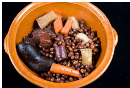
Alubias rojas de Ibeas de Juarros, Burgos

Es el plato de cuchara estrella en la gastronomía burgalesa, ideal para consumirse en estos meses en los que es frío es característico en nuestras tierras. Toma su nombre del recipiente tradicional en el que se cocina, y del hecho de ser un plato fuerte, adecuado para el invierno. Varias teorías explican el porqué de su curioso nombre, aunque suele admitirse que procede de olla poderida "olla de los poderosos" haciendo referencia a que sólo los pudientes podían costearse tan succulento plato, o bien, refiriéndose a los «poderosos» ingredientes que la componen, que dan poder y fuerza al comensal. Es un plato antiquísimo, de hecho los escritores de nuestro Siglo de Oro como Cervantes o Calderón de la Barca hablan de ella. La base de la receta son la judía roja de Ibeas, complementada con ingredientes cárnicos fuertes: morcilla de arroz, chorizo, costilla, panceta, oreja y morro del cerdo o pezuñas. En el mes de noviembre Ibeas de Juarros celebra su Feria de la Alubia Roja.