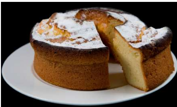
Bollo Maimón, Salamanca