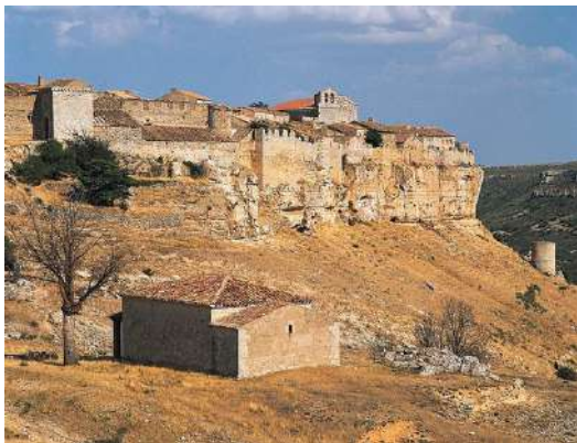
Castillo de Rello, Soria