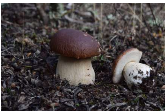
Micología zamorana

Cuando se habla de Zamora, se habla de sabor, de belleza, de calidad, de calor humano y sensaciones irrepetibles. Y entre ellas, las que tenemos al hablar de monte, micología, salidas en familia para recoger setas y de buenos platos. Con más de 500 especies de hongos inventariadas, la provincia de Zamora concentra una de las mayores producciones de setas de España. Cada año, muy especialmente en las campañas de otoño y primavera las asociaciones micológicas, instituciones y hostelería de la provincia ponen a disposición del visitante diferentes posibilidades para vivir una experiencia única vinculada al recurso micológico. Así el visitante puede adquirir un permiso recreativo para dos días que por 10 € le permitirá recorrer las áreas micológicas adheridas al proyecto recolectando hasta 3 kg de setas al día. Explorar la excelente oferta hostelera de restaurantes micológicos o para aquellos que deseen descubrir de la mano de expertos otras especies menos conocidas contratar el servicio de los guías micológicos acreditados. La celebración de jornadas micológicas, el museo micológico de Rabanales, salidas al campo y los fines de semana de gastronomía micológica, con menús con excelentes a precios muy recomendables son parte de la multitud de posibilidades que ofrece la zona regulada de la provincia de Zamora.