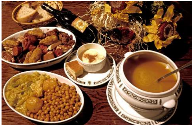
Cocido Maragato, León