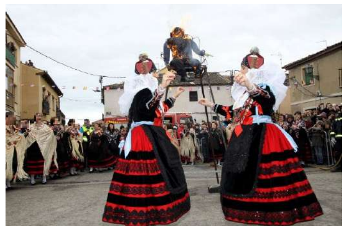
Fiesta de Santa Águeda. Zamarramala, Segovia

Santa Águeda, mártir siciliana de nacimiento, es considerada la protectora de las mujeres embarazadas, madres lactantes, y de la mujer en general. El origen de esta fiesta en Zamarramala, que al parecer se celebra desde 1227, está relacionada con la conquista de El Alcázar. Las zamarriegas, ataviadas con sus mejores galas al atardecer, consiguen distraer al cuerpo de guardia con sus bailes y así, permitir que los zamarriegos conquisten El Alcázar. Entre los privilegios que se consiguieron fue el que las mujeres mandaran una vez al año. Aunque esta fiesta ha sufrido variaciones, la esencia permanece. Declarada de Interés Turístico Regional, ésta tiene una duración de varios días, aunque el que más atracción produce es el domingo posterior al 5 de febrero. En ese día podemos acompañar a la Alcaldesa y aguederas después de la misa, a la procesión, la jura de banderas, bailes, su pregón, la entrega de los premios "Ome Bueno e Leal", "Matahombres" y "Aguederas Honorarias" y, por supuesto, la quema del pelele. Tras estas actividades, no podemos dejar de probar la típica "tajada de chorizo" cocida al vino.