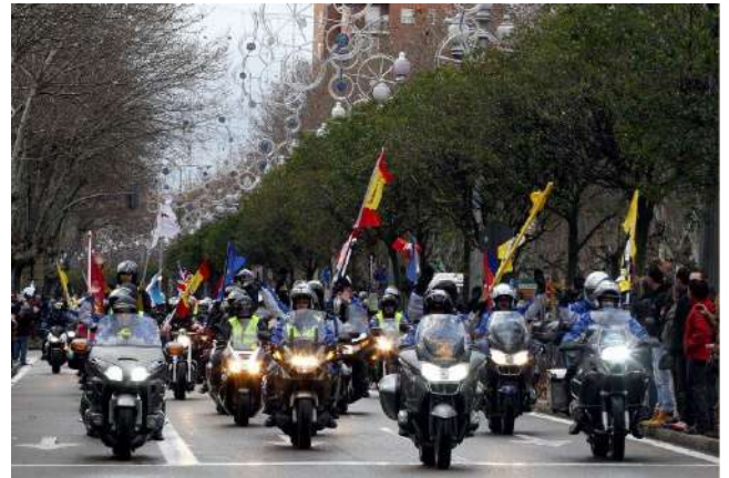
Los Pingüinos, Valladolid

Desde el año 1982, con una duración de cuatro días, de jueves a domingo, suele ser el segundo fin de semana después de reyes, se viene celebrando en la provincia de Valladolid, la concentración motera invernal más importante de toda Europa, a la cual acuden aficionados de la motocicleta de todas las partes del mundo. En la última edición celebrada se alcanzaron las 33.000 inscripciones y este año, al ser el 40 aniversario y tras el año pasado no celebrarse a causa de la pandemia, se espera que se supere esta cifra. Para los que nunca habéis oído hablar de pingüinos, os cuento alguna de las cosas más destacadas. En el pinar, los participantes montan las tiendas de campaña rodeadas de hogueras para las cuales se proporciona leña, también se da café de puchero, que ayuda a entrar en calor dadas las bajas temperaturas de la época, desayuno y cena. Hay bares, restaurantes, tiendas de merchandising... Dentro de las muchas actividades que se realizan, hay conciertos a casi todas horas, el famoso desfile de banderas en el que se va hasta el centro de Valladolid y la fiesta de nochevieja y año nuevo pingüinero, en la cual las uvas de las campanadas son sustituidas por piñones. Tanto si eres aficionado de la moto como si no, no puedes perdértelo.