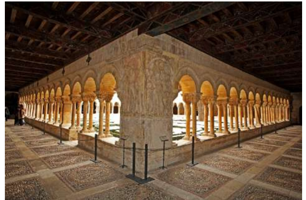
Claustrum de la Abadía Benedictina. Sto Domingo de Silos, Burgos

El último sábado de enero se celebra en la bonita localidad de Santo Domingo de Silos la Fiesta de Los Jefes, declarada de interés turístico regional. Se trata de una de las fiestas de invierno más singulares de nuestra provincia que hunde sus raíces en la invasión musulmana de la Península, cuando la leyenda dice que un ejército moro sitió la villa, simulando las gentes de Silos un incendio, para que el enemigo diera por inútil el asedio. La complejidad de la fiesta y su variedad etnográfica conforman un ritual a través de la superposición de diversas tradiciones y orígenes, algunos históricos, otros imaginados, dotado de una plurisignificación antropológica tan apasionante como intrincada, que convierte el festejo en uno de los más característicos de la geografía burgalesa.