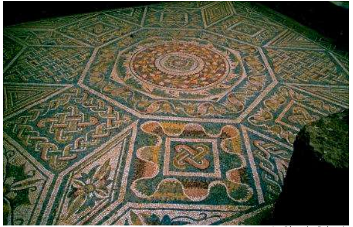
La Olmeda, Palencia