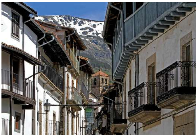
Sierra de Béjar, Salamanca