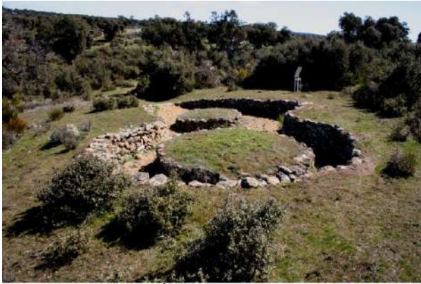
Castro de la Mesa de Miranda, Ávila