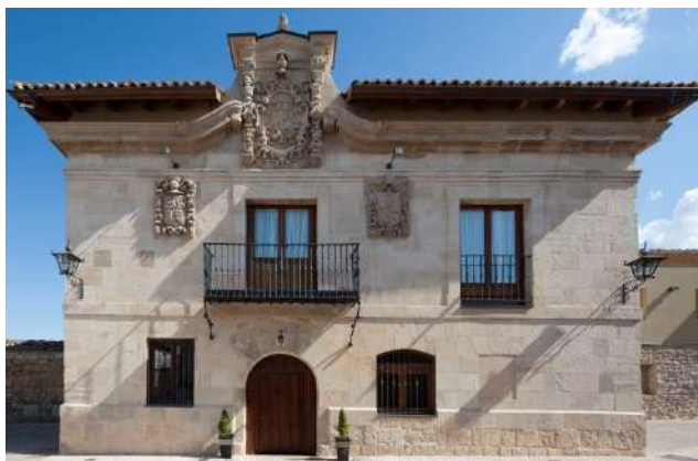
Posada Real Concejo Hospedería, Valoria la Buena, Valladolid