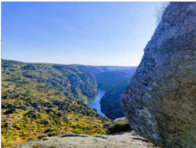
Mirador de Peña Redonda. Villardiegua de la Ribera, Zamora

Peña Redonda es, como su propio nombre indica, un gran bolo granítico en torno al cual se asentó hace más de dos mil años una tribu celta. Después, el castro fue habitado por los romanos. Aquí encontramos uno de los miradores más impresionantes de los Arribes del Duero. Detrás del cañón, que se abre ante nosotros en toda su plenitud, divisamos las viviendas de la localidad portuguesa de Vale de Águia. Podemos llegar con el coche hasta el mirador. Antes de subir al lugar de las ansiadas vistas, encontraréis los restos de la ermita medieval de San Amede, en cuyos alrededores se levantó un santuario en el que, según algunos arqueólogos, se llevaron a cabo distintos rituales y sacrificios. Merece la pena desde aquí acercarse hasta el cruce donde arranca el sendero de la Ribera de los Molinos. Un tramo de gran belleza donde descubriremos 9 molinos de agua que zigzaguean junto al arroyo del Pontón que nos llevan a otro corte espectacular sobre los Arribes del Duero.