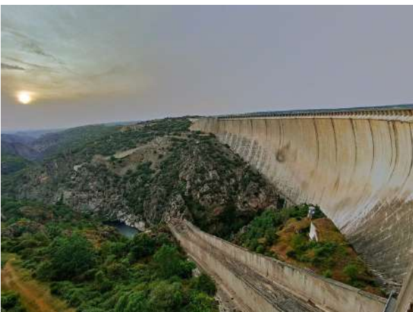
Presa de La Almendra, Zamora

El río Duero y sus afluentes han excavado en la frontera natural con Portugal, una sorprendente sucesión de cañones sobre los que se han levantado espectaculares presas y saltos hidroeléctricos. La presa de la Almendra, acumula las aguas del Tormes, justo antes de unirse al río Duero. Es un auténtico mar interior con sus más de 2600 3 hm de capacidad y ostenta el récord de altura, con 200 metros hasta la coronación de la presa. Un fascinante túnel, excavado en la roca, de 7 metros de ancho y 15 kilómetros de longitud lleva el agua desde la presa hasta la central subterránea en Villarino de los Aires, una compleja obra de ingeniería que permite revertir las turbinas y devolver las aguas al embalse matriz. Estas presas colosales son escogidas por los publicistas como escenarios ideales para filmar anuncios impactantes y también por cineastas que buscan planos dignos de escenas imborrables. Los protagonistas de películas como "Doctor Zhivago", "La Cabina" y "Terminator" conocen estos escenarios por haberse filmado importantes escenas en estas pantallas de hormigón, y empresas automovilísticas acuden a estos monumentos de la ingeniería civil para anunciar sus vehículos más sofisticados.