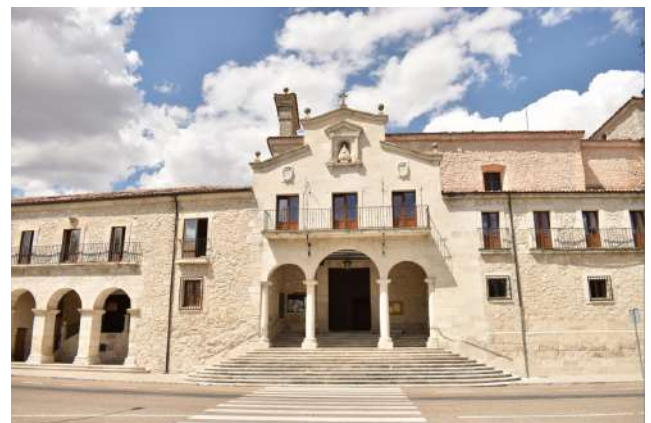
Santuario de Ntra. Sra. del Henar, Cuéllar, Segovia (cecida Turismo Cuéllar)

El Santuario de Nuestra Señora del Henar es un centro espiritual ubicado a 5 kilómetros de la Villa de Cuéllar, en tierra de pinares. Dispone de un área recreativa con frondosos árboles y fuentes para disfrutar de una jornada muy apacible. Cuenta la leyenda que la talla de la Virgen del Henar fue encontrada en Antioquía en el año 67 y enterrada durante la invasión musulmana. Aunque se sabe que en 1247 ya existía una aldea con el nombre de Santa María de El Henar en este entorno y fue en 1580 cuando un pastor encontró esta talla románica con toques de estilo bizantino. Patrona de los resineros y de la Comunidad de Villa y Tierra de Cuéllar, su coronación canónica tuvo lugar en 1972. Una de las actividades más reconocidas en este espacio es su romería. Tiene lugar el domingo anterior a San Mateo, entre el 14 y el 20 de septiembre. La noche anterior, se celebra la procesión de las antorchas. Y el domingo siguiente, "El Henarillo", con un tradicional mercadillo alrededor de la Fuente del Cirio, lugar donde según la tradición estuvo oculta la imagen hasta su aparición. Además se le atribuyen propiedades curativas a sus aguas.