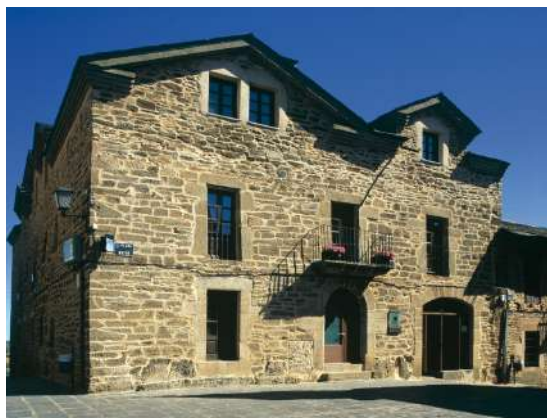
Posada de las Misas, Puebla de Sanabria, Zamora

20 Aniversario de la Marca de Excelencia Turística Posadas Reales de Castilla y León