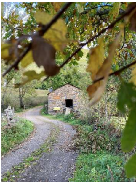
Lechería Sosas de Laciana, León