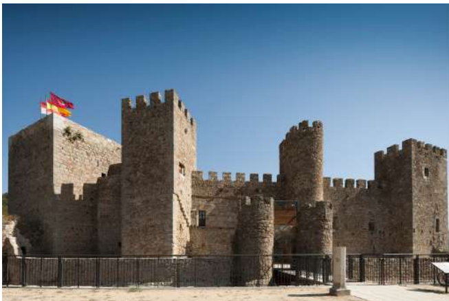
Castillo Montemayor del Río, Salamanca