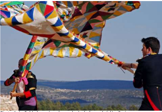
Fiesta de La Soldadesca, Iruecha, pedanía de Arcos de Jalón, Soria

Iruecha, pedanía de Arcos de Jalón, celebra sus fiestas el penúltimo fin de semana de agosto, en honor a la Virgen de La Cabeza. El día central es el sábado, aunque la fiesta comienza el viernes con el pregón oficial. Un mercado medieval sirve como aperitivo al espectáculo de gran atractivo y vistosidad: La Soldadesca. La representación consiste en la batalla entre moros y cristianos. El espectáculo narra el intento de los musulmanes por tomar la plaza de Iruecha y la imagen de su patrona, el rechazo de los cristianos, y finalmente la conversión de los moros al cristianismo. Otros actos relevantes de la fiesta son: El baile de las Banderas (en el que los Oficiales. Tomando el estandarte por el asta y dan vueltas sobre la cabeza con el paño desplegado). El Rosario de los Faroles (una procesión que parte y termina en la iglesia y que goza de gran devoción popular). Y el tradicional Baile de las Espadas (recientemente recuperado por un grupo de mujeres del pueblo).