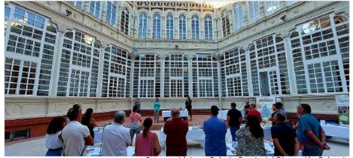
Cata maridaje en Palacio Provincial Diputación Palencia

¿Te apetece disfrutar de una visita guiada al Palacio Provincial de la Diputación de Palencia y luego una cata maridaje en el patio de este precioso edificio modernista? Pues no pierdas la oportunidad de reservar tu plaza. La campaña #SaborearLoAuténtico nos propone conocer la comarca del Cerrato Palentino, como destino enoturístico promocionando y dando a conocer los vinos que se elaboran en las bodegas palentinas, amparadas por las D.O. Arlanza y Cigales, maridados con los productos de la marca de calidad Alimentos de Palencia, haciendo así un recorrido por los recursos y productos turísticos que atesora el Cerrato Palentino, destacando los barrios de bodegas subterráneas de Baltanás y Torquemada, declarados Bien de Interés Cultural en la categoría de conjunto etnológico, junto a otros conjuntos históricos como Dueñas, Astudillo o Palenzuela, y monumentos singulares como la Basílica de San Juan de Baños, así como las diferentes propuestas de ocio que ofrecen los entornos naturales del Cerrato como por ejemplo, los descensos fluviales.