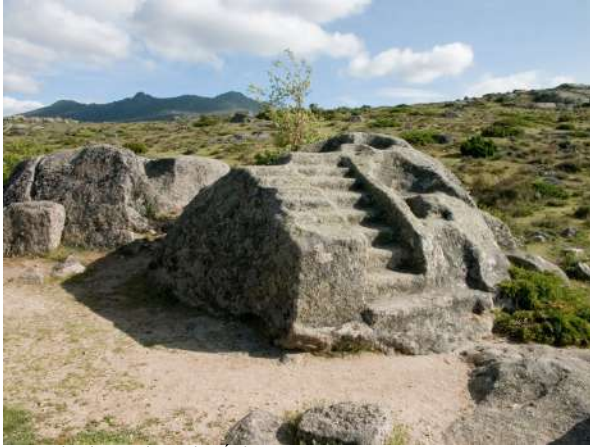
Castro de Ulaca, Solosancho, Ávila