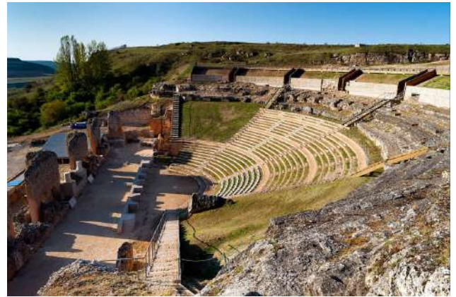
Anfiteatro de Clunia, Burgos

El Festival tiene como marco incomparable el Teatro Romano de Clunia, situado en la localidad de Peñalba de Castro, que albergará varios espectáculos los días 11, 12, 13, 18 y 19 de agosto. La ciudad romana de Clunia Sulpicia, fue una de las mayores y más importantes urbes de la Hispania Romana. Antes de los romanos, Clunia fue un asentamiento de los arévacos, al igual que solar de cántabros y vascones. Tiberio fundó en ella un "municipium" romano y más tarde, en tiempos de los emperadores Galba o Adriano, obtuvo el rango de Colonia, "Colonia Clunia Sulpicia". La ciudad, llegó a tener más de 30000 habitantes. Destacamos su teatro excavado en la roca, con capacidad para 9000 espectadores, el conjunto termal de "Los Arcos", el foro (plaza pública, centro religioso, administrativo y comercial), donde se levantaban el templo dedicado a Júpiter y los tribunales de justicia, así como el magnífico conjunto de mosaicos descubiertos en muchas de sus casas señoriales.