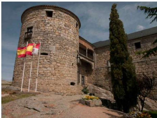
Castillo Palacio de Magalia, Las Navas del Marqués, Ávila

Situado en la parte más alta de la hermosa villa de Las Navas del Marqués, fue en su día centro político y administrativo del marquesado y de la villa. Fue mandado construir a mediados del siglo XVI por D. Pedro Dávila y Zúñiga, Primer Marqués de Las Navas, y su esposa, María de Córdoba y estuvo habitado durante dos siglos por los descendientes de este primer marqués. De planta cuadrada y con torres en los ángulos exteriores, en él se pueden apreciar la pureza y esplendor del Renacimiento. En la fachada principal podemos admirar cuatro balcones volados, ventanas enrejadas de estilo renacentista, puerta de arco de medio punto coronada por un frontón triangular con el escudo de los Dávila y friso en caracteres latinos. En el interior hay un espacioso zaguán con majestuosos escalones de piedra y techo artesonado y tras él el Patio de Honor organizado en dos alturas. Paseando por las galerías del patio se pueden contemplar litografías de obras del museo del Prado y una colección de baúles del siglo XIX mientras que en el Salón de Honor descubrimos los objetos más valiosos del palacio. En 1931 fue declarado Monumento Histórico Artístico.