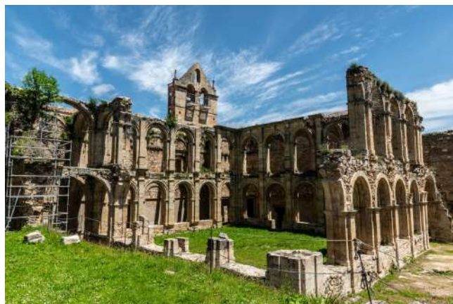
Monasterio de Rioseco, Valle de Manzanedo, Burgos

El Monasterio de Santa María de Rioseco, fundado en el siglo XIII, fue uno de los monasterios cistercienses más importantes del norte de Burgos. Estuvo habitado durante siglos por "monjes blancos" de la Orden del Císter. Estos monjes crearon una explotación agrícola y ganadera ejemplar en el Valle de Manzanedo, destacando los cultivos de trigo, viñedos, frutales, lino, y con una explotación de unas 2.000 ovejas. Su declive comenzó en el siglo XIX, principalmente en 1836 con la desamortización de Mendizábal. Resaltan las bellas bóvedas de crucería de la iglesia y parte del claustro renacentista. Desde el año 2010, se llevan realizando diferentes actividades que buscan la recuperación del monasterio con voluntarios de la asociación Salvemos Rioseco, donde Iglesia, municipio, asociaciones y voluntariado trabajan en la restauración del Monasterio. Las ruinas de este Monasterio son de interés turístico.