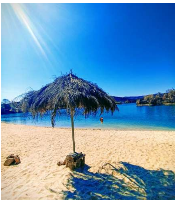
Playa Cional, Zamora

Para disfrutar este verano, qué mejor que refrescarse en una de las playas zamoranas. Zamora, a pesar de ser de una provincia interior, cuenta con varias playas fluviales, en lagos o embalses. Hoy os descubrimos la Playa de Cional, en el embalse de Valparaíso, a 200 metros del propio pueblo del mismo nombre, junto a la carretera, dentro de la Sierra de la Culebra. Cuenta con bar, servicios, instalaciones deportivas, un parque infantil, aparcamientos y mil metros de césped para el uso y disfrute de los usuarios. Es una playa de arena y posee una zona de arboleda estupenda junto al agua. Muy cerca, en el municipio de Villardeciervos, en medio de un frondoso rebollar se abre paso junto al embalse de Valparaíso, otra de las playas más grandes y estupendas de la provincia: la playa de Los Molinos.