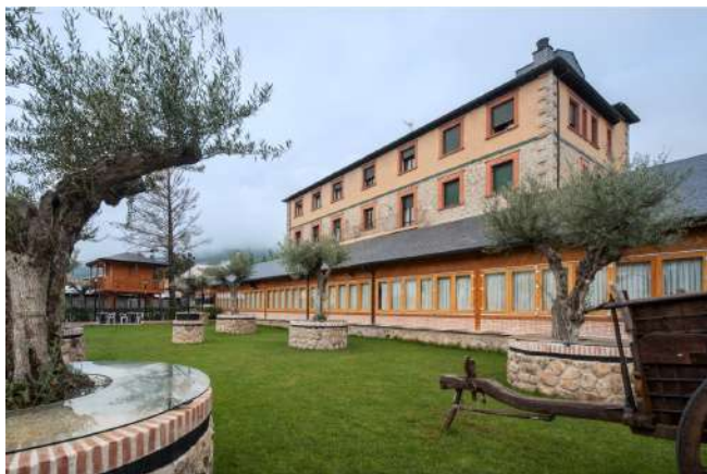
Posada Real Quinta San José, Piedralaves, Ávila