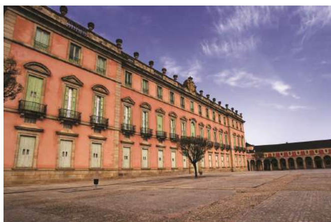
Palacio de Riofrío, Segovia

Proponemos una visita al Palacio Real de Riofrío. Isabel de Farnesio, segunda esposa de Felipe V, es quien manda construir este lugar por miedo a quedar privada del palacio y jardines de La Granja, pues habiendo muerto su marido, es su hijastro Fernando VI (con el que no tiene muy buena relación) quién sucede en el trono a Felipe V. En poco tiempo, muere Fernando y pasa al trono Carlos III, hijo de Isabel, lo que hace que ésta vuelva a tener un papel destacado en la corte y no llegue a habitar el Real Sitio, convirtiéndose, a pesar de sus grandes dimensiones, en un pabellón de caza. Sólo ha sido habitado en dos ocasiones: por el Rey consorte Francisco de Asís y el Rey Alfonso XII, para pasar el luto de su mujer María de las Mercedes, en 1878. Cabe destacar su escalera, una de las más bellas y logradas del barroco español, y su museo de caza, donde se puede ver su colección de taxidermia. Interesante también el bosque que rodea a este espacio, de unas 640 hectáreas y en el que podemos disfrutar de los ciervos, gamos y aves de esta importante reserva biológica y ecológica.