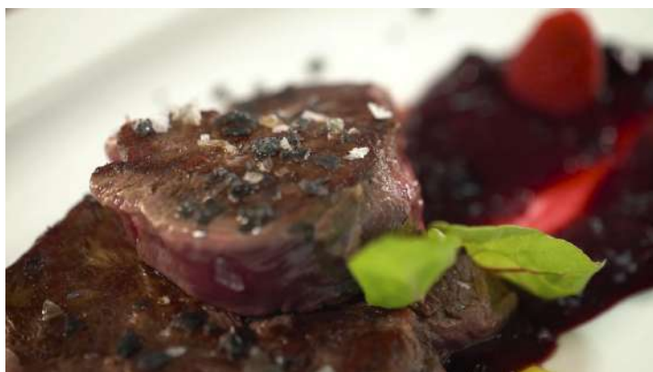
Carne Morucha de Salamanca