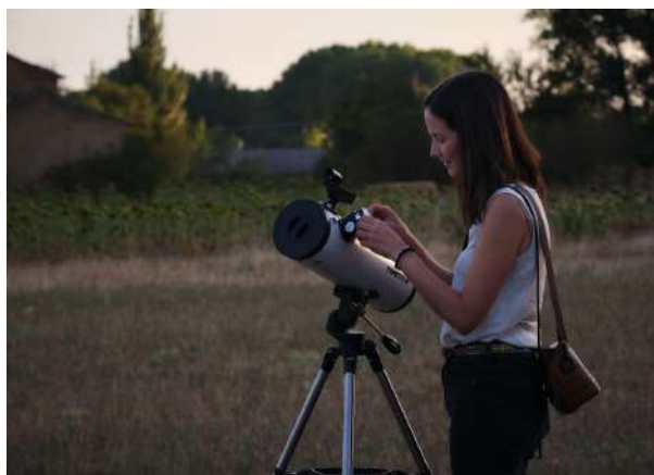
Astroturismo, Frómista, Palencia

¿Cuántas veces nos quedamos absortos mirando al cielo en las noches despejadas? Esas noches en las que las estrellas brillan intensamente y llaman nuestra atención. Y así imaginamos a los marineros de antaño en sus barcos o a los peregrinos del medieval caminando y siguiendo las señales del cielo para llegar a sus destinos. Lejos quedaron aquellas experiencias, ahora en las grandes ciudades las inmensas edificaciones y la contaminación impiden ver estas maravillas nocturnas. Pero afortunadamente en lugares más pequeños, en los preciosos pueblos del mundo rural, todavía hoy se puede disfrutar de este regalo que es viajar por las constelaciones. La Asociación "Descubre Palencia", recientemente creada por tres mujeres emprendedoras y propietarias de alojamientos con encanto en la provincia de Palencia, apuestan por las experiencias en "astroturismo" para poner en valor la observación del cielo nocturno en lugares con una magia especial. Han organizado para el verano 2023 varios encuentros en diferentes lugares de la provincia para la observación del cielo a través de telescopios profesionales: estrellas, planetas, nebulosas, etc. También habrá charlas sobre el universo, mitos y leyendas sobre las constelaciones, estrellas fugaces y muchas más actividades que serán guiadas por monitores certificados por la Fundación Starlight.