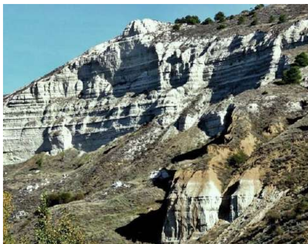
Cortados Cabezón de Pisuega, Valladolid

La senda de los cortados del Pisuega (PRC-VA8) es un recorrido circular de 8 km, homologado por la Federación Castellano Leonesa de Montaña. Tiene un gran valor geológico, con paramos, cuevas y valles, lo cual crea un paisaje idílico para los amantes del senderismo, el ciclismo e incluso la escalada. Comienza en la localidad de Cabezón de Pisuega y se puede hacer en varios tramos. El primer tramo, desde el Barrio de Bodegas al Mirador del puente. Este recorrido tiene unas vistas y unas puestas de sol inolvidables. Debido a la erosión a lo largo de millones de años del río Pisuega, se han ido creando unos enormes tajos en los cerros que forman las paredes verticales con altos precipicios. La dificultad de este recorrido es media, siendo el tiempo estimado en su realización de 2 horas y media, y cuenta con un desnivel de 157 metros.