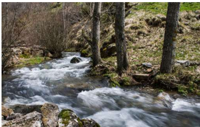
Reserva de Biosfera Omaña y Luna, León

A menos de 50 kilómetros de León, encontramos una de las comarcas más bonitas y tranquilas de la provincia. Engloba municipios como Murias de Paredes, Riello, Santa María de Ordás, Soto y Amío y Valdesamarioson. Se pueden visitar sus abundantes bosques. En sus ríos Omaña y Luna se puede disfrutar de varias piscinas fluviales naturales. Una zona para realizar rutas a pie sencillas como la del Oro de Roma que parte del pueblo de Las Omañas o más largas, como la de las Fuentes de Omaña que tiene como punto de partida y llegada el pueblo de Murias de Paredes. Si te digo que esta comarca situada a los pies de la Cordillera Cantábrica y a los Montes de León forma parte de la reserva de la biosfera de los valles de Omaña y Luna ¿Puedes imaginar lo espectacular que puede ser?