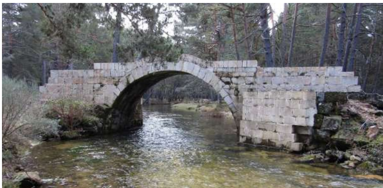
Puente de Santo Domingo, Covaleda, Soria