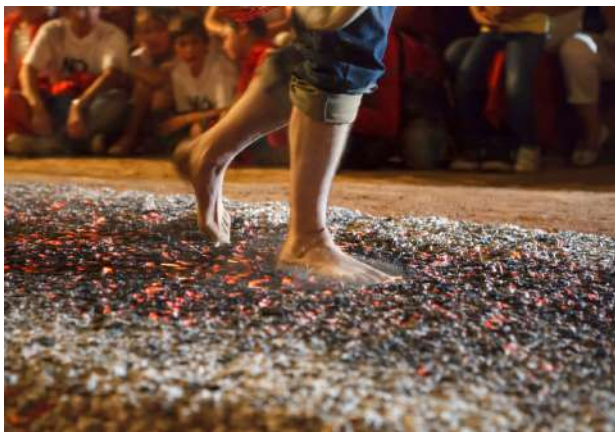
Tradicional Paso del Fuego en San Pedro Manrique, Soria