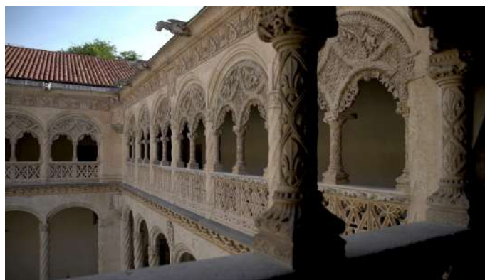
Museo Escultura, Valladolid

Valladolid cuenta con un gran número de museos, ubicados en impresionantes edificios y con una rica y diversa oferta cultural. Podemos disfrutar tanto de pinturas y esculturas, como de los edificios en sí. Uno de los más importantes es el Museo Nacional de Escultura, ubicado en el colegio de San Gregorio, gran ejemplo del gótico isabelino, es considerado el mejor en escultura religiosa de madera policromada de Europa. Tiene obras de los ilustres, Juan de Juni y Gregorio Fernández, entre otros. El Museo Casa de Cervantes, es la única casa del escritor que se conserva en España. Viviendo aquí gestionó la publicación de la primera parte de la exitosa novela de Don Quijote de la Mancha. Tampoco nos podemos olvidar del Museo de Valladolid, en el Palacio de Fabio Nelli, el cual alberga una amplia colección de arqueología y una zona dedicada a piezas históricas y artísticas de la provincia de Valladolid. Estos son sólo algunos de los muchos que hay para visitar, tanto en la ciudad como en la provincia.