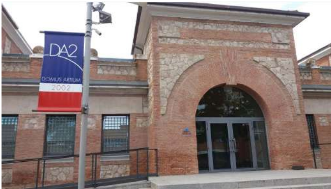
Domus Artium 2002, Salamanca