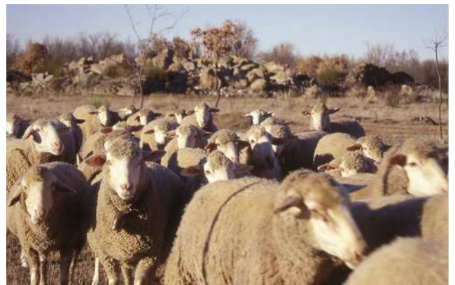
Rebaño de ovejas en la Cañada Real, Segovia

Las Cañadas Reales cruzaban la Península prácticamente de norte a sur. En el caso de Castilla y León, la actividad ganadera es bien conocida, por lo que son bastantes las Cañadas Reales y vías pecuarias que pasan por nuestra Comunidad. Tienen una gran importancia económica, geográfica y medioambiental. Este último caso es especialmente relevante porque debido a su protección, hoy en día es muy utilizado a nivel de senderismo y de rutas en bici. Por la provincia de Segovia atraviesan tres Cañadas Reales: La Cañada Real Leonesa Oriental, La Cañada Real Segoviana y La Cañada Real Soriana Occidental. Destacaremos esta última gracias a su conservación, señalización y por estar situada a lo largo de la Sierra de Guadarrama. También denominada "La Vera de la Sierra", en una parte coincidirá con el sendero de gran recorrido GR-88. En esta calzada encontraremos elementos relacionados con la actividad trashumante como esquilos y lavaderos, en algunos casos, muy bien conservados. Además, un paisaje variado entre pinos, melojos, sabinas, encinas, una gastronomía popular como la caldereta, asados, migas del pastor. Y mucho patrimonio cultural y artístico; ermitas, pueblos con encanto, fuentes, potros de herrar, abrevaderos, puentes. En definitiva, un paisaje del que disfrutar con todos los sentidos.