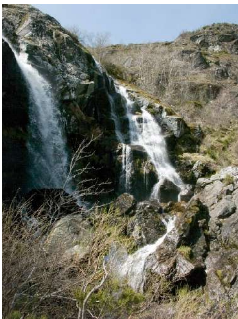
Cascadas de Sotillo, Sotillo de Sanabria, Zamora

Es una ruta de 7 km (ida y vuelta), dificultad media. Está señalizada con balizas de color marrón. Se puede hacer todo el año, en especial primavera y otoño. Es una de las rutas más bonitas del Parque Natural y posiblemente una de las más conocidas. La ruta comienza en Sotillo de Sanabria donde dejaremos el coche, cerca del puente sobre el río Truchas. Empezaremos a andar por el camino empedrado y a veces con agua que nos llevará a las cascadas, está senda sale a mano izquierda y estará marcada por balizas de color marrón, una vez en la senda no tendremos ningún problema de pérdida hasta llegar a las cascadas de Sotillo. Durante la ascensión, con algo de dificultad por las piedras, podremos admirar bosques auténticamente vírgenes de especies como acebos, robles, castaños y avellanos. Antes de poder divisar las cascadas, oiremos el caer de las aguas sobre el río Truchas, hay que tener cuidado con la fuerte pendiente que nos llevará al río. El agua de las Cascadas de Sotillo procede de la Laguna de Sotillo que se encuentra a 1.600 metros.