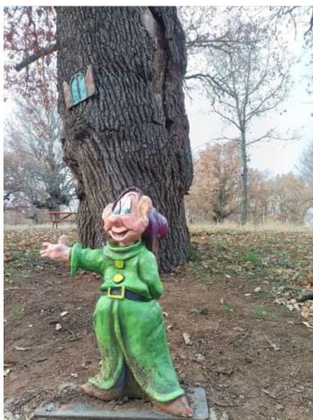
Bosque de los Enanitos, Almanza, León