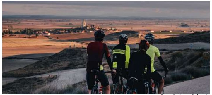
Ruta Cyclope, Palencia

Si sois amantes de la bici, las rutas, los desafíos, el patrimonio, la naturaleza y la buena gastronomía, esta es vuestra gran ruta. "Cyclope" os propone descubrir nuestra provincia y disfrutar de vuestra pasión ciclista con varias modalidades diferentes. La primera de ellas "Palencia Roud" a través de 5 jornadas de carretera con 481 km con desnivel positivo +4.059 metros que os llevarán desde las infinitas llanuras de Tierra de Campos hasta la impresionante Montaña Palentina. La segunda "Palencia Gravel" 7 etapas con 586 km y un desnivel positivo de +5.431 metros por caminos de pasado minero o por los de la tradición vitivinícola. Pero si queréis más "Road Bike Stages" 6 destinos a lo largo y ancho de la provincia de Palencia donde encontraréis localidades preparadas para acoger concentraciones de clubes y campus de tecnificación en función de los objetivos de entrenamiento. Y si os gusta la emoción de la competición luchando contra las propias marcas o intentando superar los tiempos de los competidores, "Road Racing Series" es vuestro reto.