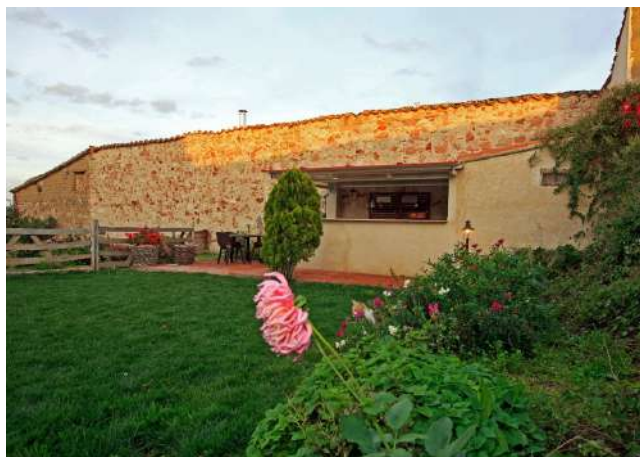
Posada Real La Posada del Buen Camino, Villanueva de Campeán, Zamora