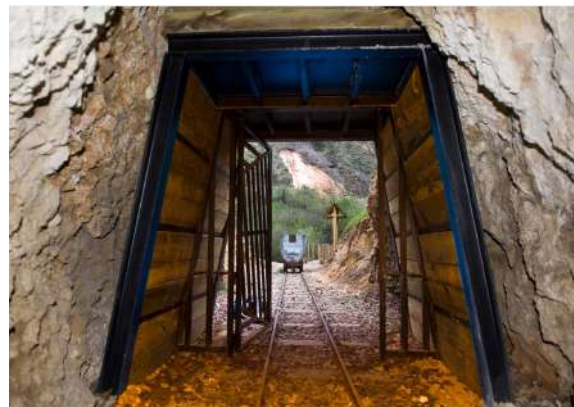
Mina, Puras de Villafranca, pedanía de Belorado, Burgos