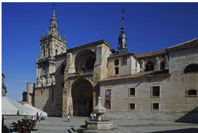
Catedral de El Burgo de Osma. Soria