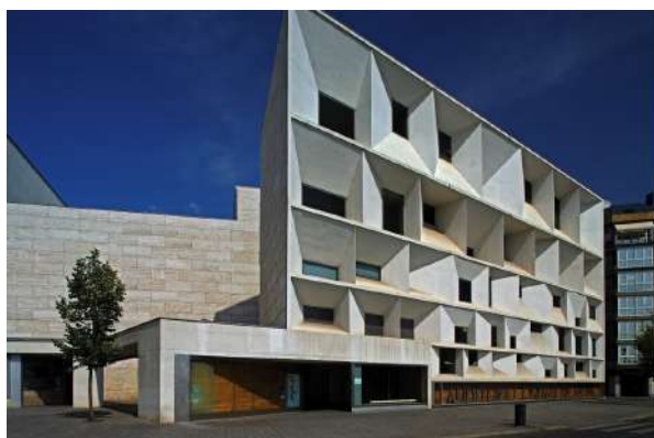
Auditorio Ciudad de León

La Historia con sus diferentes civilizaciones, estilos artísticos han dado lugar a un León moderno y actual, que ha sabido combinar lo antiguo y lo moderno manteniendo intacta su memoria con el paso de los siglos. El León contemporáneo, más desconocido para la mayoría, puede tener un recorrido diferente y no menos interesante que el antiguo: Edificios como el galardonado Auditorio ciudad de León y el Musac premiado en 2007 como la mejor arquitectura realizada en Europa (ambos de los arquitectos Mansilla y Tuñón), el Ente Regional de Energía (muestra de un urbanismo inteligente), el edificio de la Junta de Castilla y León, el tanatorio (perfectamente integrado en la ciudad), la plaza de Santo Domingo, la Glorieta de Guzmán (recibiendo a los que llegan en bus y tren a la ciudad) y la calle Ordoño II considerada como calle insignia del León más actual son algunos de los más reseñables.