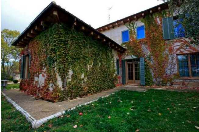
Posada Real Finca Fuente Techada, Sotosalbos, Segovia