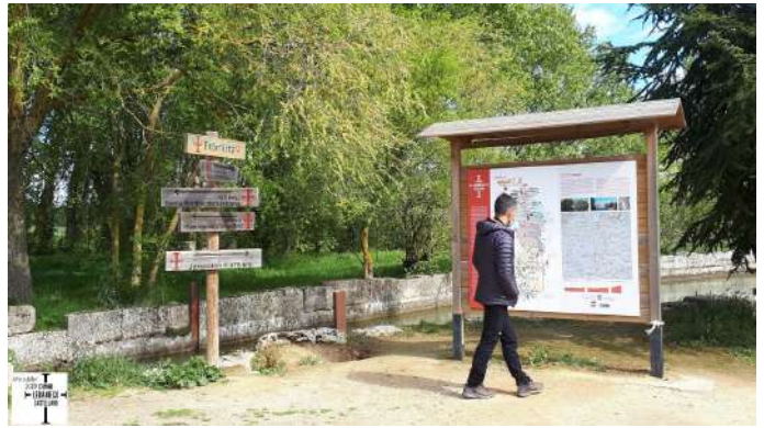
Camino Lebaniego en Frómista, Palencia

El Año Jubilar Lebaniego hace referencia a aquel año cuyo 16 de abril cae en domingo, día en que se celebra la festividad de Santo Toribio. La conmemoración del Año Santo Lebaniego comenzó en el siglo XVI, con la bula del Papa Julio II de 23 de septiembre de 1512, que otorgaba el privilegio de la celebración del Año Jubilar Lebaniego. El último fue en 2017 y este 2023 será el número 74 año santo que se celebra. "Camino Lebaniego Castellano" es un itinerario cultural entre la ciudad de Palencia y el Monasterio de Santo Toribio de Liébana en Cantabria. Es una vía tradicional de peregrinación que ya aparece citada en 1455 y de la que queda constancia en el Libro de Actas de la catedral de Palencia. El "Camino Lebaniego Castellano" se inicia en la dársena del Canal de Castilla en la capital palentina y aprovecha en el primer tramo sus sirgas o caminos, siguiendo por las vías que los romanos dejaron por las localidades de La Pernía, la calzada del «Burejo», que partía desde Pisoraca (Herrera de Pisuerga) y que cruzaba hacia Cantabria por el Puerto de Piedrasluengas. Anímate y solícitanos ya tu credencial lebaniega para ir sellando por esta fantástica ruta de peregrinación.