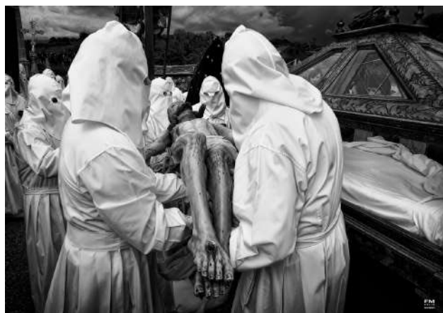
Cofrades Bercianos, viernes santo, Zamora

La Semana Santa de Bercianos de Aliste en Zamora es un ejemplo único de fervor religioso, tradición y unión entre sus cofrades. Fue declarada "Bien de Interés Cultural" de carácter Inmaterial por la Junta de Castilla y León, así como Fiesta de Interés Turístico de Castilla y León, congrega cada año a cientos de personas en un pequeño pueblo del oeste zamorano para revivir la Pasión y Muerte de Cristo con un ritual solemne y austero que no deja indiferente a quien lo presencia por primera vez. Su procesión de capas pardas alistanas la tarde del Jueves Santo, que parece viajar en el tiempo a una época donde no existían ni el reloj ni las preocupaciones triviales de la vida moderna, la representación vivida del desenclavamiento y entierro de Cristo, a quien los cofrades acompañan vistiendo las que algún día serán sus mortajas, túnicas blancas de lino. El silencio solo roto por las voces que entonan el Miserere, y sobre todo, la implicación de la práctica totalidad de los vecinos del pueblo en la que es su semana más grande, hacen de la Semana Santa de Bercianos de Aliste uno de las tradiciones religiosas más significativas no solo de la provincia de Zamora, sino de todo el país.