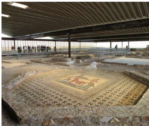
Museo Villas Romanas, Almenara, Valladolid

El Museo de las Villas Romanas y la Villa Romana de Almenara-Puras fueron declaradas "Bien de Interés Cultural" en el año 1994. La casa fue construida en el siglo IV y habitada hasta el siglo V. La visita a la villa muestra el itinerario de las diferentes estancias, con los suelos de mosaicos y algunas de las pinturas originales en sus paredes y da una visión de la vida en el campo durante aquella época. Hay un total de 400 m 2 de mosaicos, siendo el más importante el llamado "Pegaso". También hay unas termas que tienen frigidario y caldario, este último con calefacción distribuida por debajo del suelo. Se accede a través de un pasillo y se termina en una sala de planta trilobulada. Es una villa de enorme interés para los niños, que además pueden disfrutar de un parque infantil tematizado que se encuentra en el exterior.