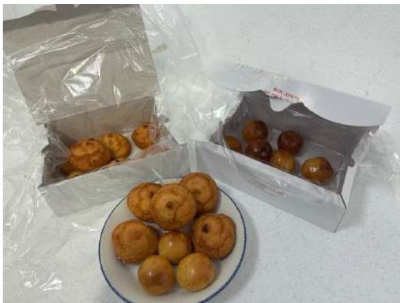
Dulces conventuales salmantinos