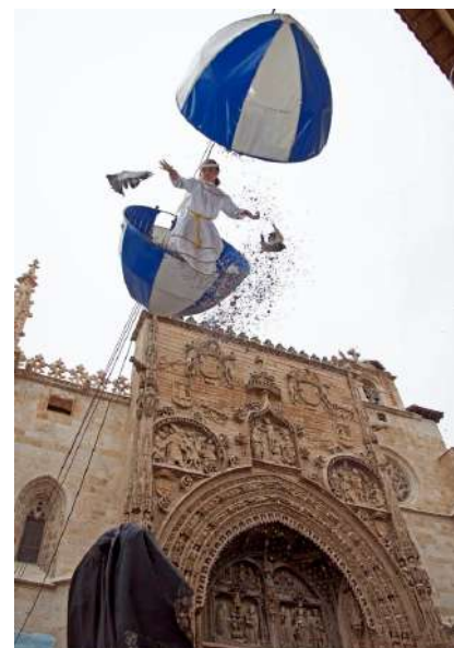
Bajada del Ángel, Aranda de Duero, Burgos

El momento más esperado de la Semana Santa de Aranda de Duero es la Bajada del Ángel, declarada Fiesta de Interés Turístico Nacional. El Domingo de Resurrección, este año el 9 de abril, un niño o una niña, con vestidura de ángel desciende por un cable en el interior de un globo azul y blanco, desde la preciosa fachada de la iglesia de Santa María. Al encontrarse encima de la imagen de la Virgen de las Candelas, el globo se abre y el Ángel baja revoloteando a retirar el manto negro de luto que cubre la talla, celebrando el júbilo de la Resurrección de Cristo, cuya imagen se ha encontrado previamente con la de su madre, frente a la iglesia. A continuación, el Ángel acompaña a la procesión debajo de la andas de la Virgen portando con orgullo el manto negro que le ha retirado y saludando sonriente a los asistentes.