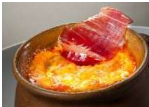
Sopa castellana tradicional con pan de Valladolid

Valladolid es conocida mundialmente por su gastronomía, por sus platos tradicionales y sobre todo por sus tapas y vinos, los cuales se pueden degustar a lo largo de toda la ciudad en los diferentes bares y restaurantes. Un indispensable es el Lechazo asado, generalmente, está hecho en horno de leña, aunque también se puede probar de otras maneras como puede ser en chuletillas o en pinchos. En invierno y debido a la climatología de la ciudad del Pisuerga, lo más típico son las Sopas de Ajo. El pan de Valladolid, es un alimento protegido de Castilla y León, que tiene la Marca de Garantía propia desde 2004. En cuanto al dulce, el municipio de Portillo elabora los Mantecados de Portillo, y en otros municipios tenemos las Ciegas de Íscar, las Marinas de Medina de Rioseco. Y también hay productos salados, como el Queso de Villalón, la Morcilla de Cigales, las Salchichas de Zaratán. Dependiendo de la época del año que sea, se consumen diferentes elaboraciones. En Semana Santa es típica la Torrija, el día 8 de septiembre en las fiestas de la ciudad la Tarta de San Lorenzo y en el día de Todos los Santos los Buñuelos.