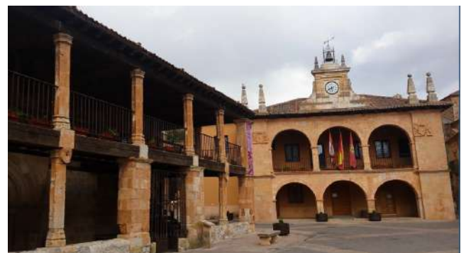
Plaza Mayor de Ayllón, Segovia

Villa situada al Nordeste de la provincia, es una Villa Medieval Conjunto Histórico Artístico de carácter nacional desde 1973. Llegar a Ayllón supone un viaje al pasado que comenzaremos cruzando su Puente Romano y adentrándonos en el pueblo a través de su Arco (el único que queda de los tres que tuvo el recinto amurallado de la villa). Sobre éste descansan cuatro escudos pertenecientes a cuatro de las familias más ilustres del lugar. Tras pasarlo, nos encontraremos con el Palacio de los Contreras, de estilo gótico isabelino, la Plaza Mayor porticada y el Palacio del Obispo de Vellosillo, eminente teólogo que participó en representación de Felipe II en las deliberaciones del Concilio de Trento y llegó a ser consejero real. Actualmente este palacio alberga el Museo de Arte Contemporáneo de la Villa y la Biblioteca Municipal. Pero Ayllón ¡es mucho más! Iglesias como la de San Miguel, con la sepultura de D. Pedro Gutiérrez de César, la Iglesia de Santa María La Mayor, de estilo neoclásico, el ex-Convento de San Francisco, fundado por Francisco de Asís o el Convento de las Madres Concepcionistas, ambos de propiedad privada. Por último y siendo un icono del perfil de Ayllón, la torre de "La Martina", prueba de la existencia de una fortificación musulmana, que posteriormente pasó a ser campanario de la ya desaparecida Iglesia de San Martín.