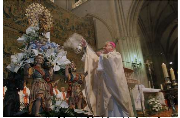
Ntra. Señora de la Calle y la Fiesta de las Candelas, Palencia

Una de las fiestas a la que más devoción tenemos los palentinos es la festividad de nuestra patrona, la Virgen de la Calle, que celebramos el 2 de febrero. Cuenta la leyenda popular, que un panadero intentaba encender su horno muy temprano para elaborar el pan, pero comenzó a tener problemas con un madero que no ardía. Tras muchos intentos y ya de muy mal humor, lo arrojó a la calle blasfemando y allí del mismísimo tronco se oyó una voz que dijo: "Puesto que a la calle me tiras, de la Calle me llamaré". Y es así que se esculpió la forma de la Virgen en este madero casi quemado y por eso se la conoce como "la Morenilla". Contando lo sucedido a su mujer y su hija que eran muy devotas éstas dieron parte al obispo del milagro, conmemorándose su fiesta desde entonces. Es una celebración hermosa con la procesión de la Virgen de Nuestra Señora de la Calle por las calles de Palencia, misa mayor y por la tarde la bendición e imposición del manto de la Virgen a todos los niños nacidos en el año para que les proteja de cualquier mal. Invitados quedáis a compartir esta preciosa tradición palentina.