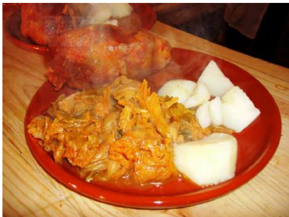
Festival de Exaltación del Botillo, Bembibre, León

Bembibre se encuentra al oeste de la provincia de León, en el Bierzo Alto. En su centro histórico destacan la Iglesia de San Pedro Apóstol, primitiva sinagoga judía transformada a finales del siglo XV en templo cristiano, la Plaza Mayor, el Barrio de la Villavieja y el Castillo, sin olvidar el Santuario del Ecce Homo, monumento más notable de Bembibre, amalgama del barroco y neoclásico. A ello se sumaría el excelente elenco de edificios modernistas vinculados en su mayoría al primer tercio del siglo XX y otros de arquitectura contemporánea. En cuanto a la gastronomía, sobresalen los productos derivados de la matanza, con un protagonista indiscutible, "el Botillo". Hablamos del embutido que se elabora con piezas procedentes del despiece (costillar, espinazo y rabo) y adobadas con sal, ajo, pimentón y orégano. Esta mezcla se introduce en una tripa natural, que después se ahúma con leña de roble o encina. Una vez cocido, suele tomarse con patatas y verdura, y también con garbanzos y chorizo. Su trascendencia es tal que cada año desde 1973 se celebra en esta localidad el Festival Nacional de Exaltación del Botillo, Fiesta de Interés Turístico Nacional que se conmemora el sábado anterior al de carnaval. En la celebración destaca la muestra y degustación de productos "Villa de Bembibre" y el "Sábado Botillero", donde se dan cita figuras relevantes de la vida pública entre las que está "El Mantenedor", al que se le encomienda ensalzar las virtudes de este manjar.