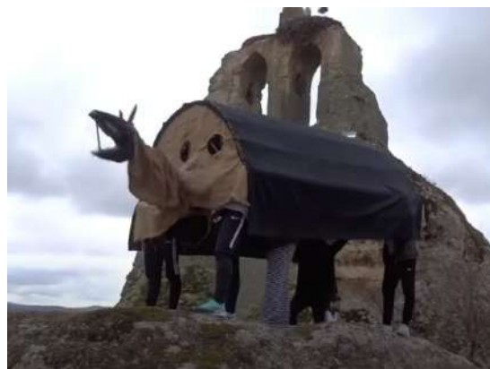
Carnaval de Hacinas, Burgos

La localidad serrana de Hacinas, conserva uno de los carnavales tradicionales más curiosos y de mayor interés etnográfico de los que encontramos en la provincia de Burgos, en que todo el pueblo se implica en celebrar su fiesta cuyo origen se pierde en el tiempo. Los días de Carnaval sale a las calles "la Tarasca", un armazón revestido de tela, construido y portado por los mozos, que recorre el pueblo amenazando con corridas y bromas a todos los que se unen a la fiesta. Otros personajes del carnaval de Hacinas que también alteran la tranquilidad de los presentes son "el Comarrajo", "los Pelusos" y "la Curra". Hacinas además cuenta con una interesante colección de árboles fosilizados y un interesante museo interpretativo.