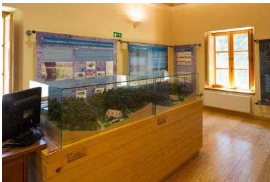
Aula del bosque Amogable, Sierra de Navaleño, Soria