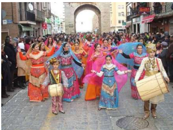
Carnaval de Toro, Zamora

El carnaval toresano es uno de los acontecimientos populares más importantes de Castilla y León. Ha evolucionado partiendo de una tradición, que en ningún caso olvida sus orígenes y los fomenta. Durante los seis días que dura la fiesta, se suceden una serie de actos que conforman el programa: fiesta de los "Sesenta", boda tradicional de infantil y adultos, concentraciones de Murgas con sus típicas coplas, concentraciones de máscaras, grupos, charangas, bailes, desfile infantil, desfile del Martes de Carnaval, el Entierro de la Sardina, concursos. Tanto en la boda tradicional de niños como la de adultos, que tiene lugar el sábado y domingo gordos, la gente luce sus mejores galas, ataviados con los trajes típicos locales: Viuda Rica y Labradora, Mantones de Manila, Capas Negras. Las Murgas, con sus típicas coplas, contadas y cantadas por las calles, son una crítica mordaz sobre los acontecimientos vividos a lo largo del año. Tiempos atrás las letras eran sometidas a juicio, autorizándose mediante firma del Delegado, el permiso para poder cantarlas. El desfile del Martes de Carnaval es el más espectacular desfile, de gran vistosidad, lleno de colorido y un derroche de imaginación, que sorprende en cada momento a quienes observan sin perder detalle, a los grupos interpretando sus parodias.