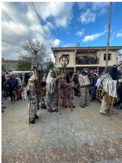
Carnaval de Navalosa, Ávila