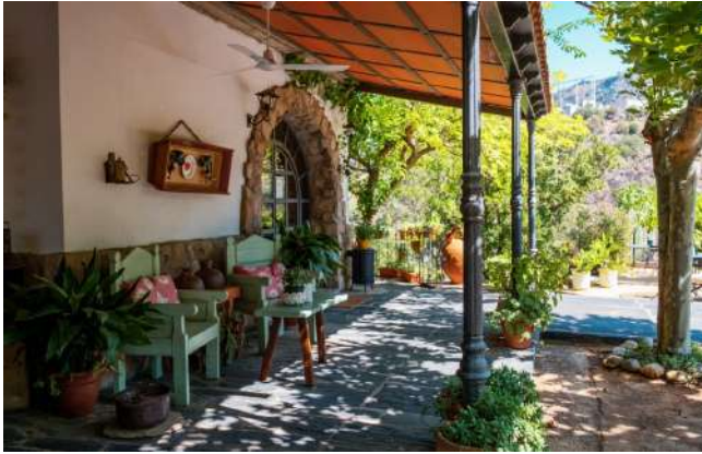
Posada Real Quinta de la Concepción, Salto de Saucelle, Salamanca