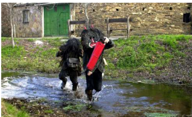
Los Carochos de Riofrío de Aliste, Zamora