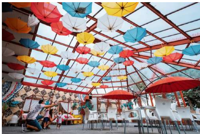
Posada Real El Indiano, Cidones, Soria