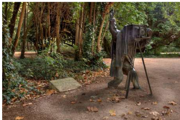
Campo Grande, Valladolid