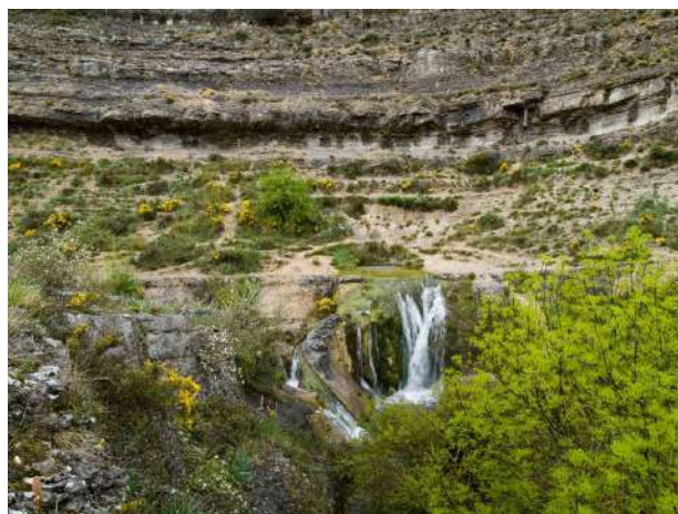
Cascada de Fuenteodra, Burgos

Cuando las precipitaciones son copiosas, especialmente en invierno y primavera, es fácil disfrutar de una amplia variedad de cascadas, el mayor atractivo turístico de la pequeña localidad de Fuenteodra, situada en el Geoparque de Las Loras. Al tratarse de una comarca caliza, el agua se filtra en la roca en busca de grietas por donde salir al exterior en forma de "chorro", cascada o manantial. En esta ruta en apenas 1500 metros y siguiendo senderos de ovejas que siguen en la colina, dirección oeste, se pueden encontrar hasta 4 cascadas a cual más interesante: la cascada del Odra, el manantial de Manapita, y los pozos de Los Aceites y del Corral. La más famosa y espectacular, ya que es la que contiene más agua, es la cascada de Yeguamea.