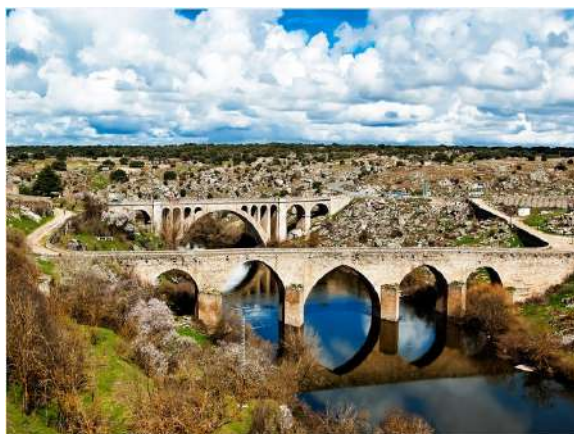
Puentes de Ledesma, Salamanca