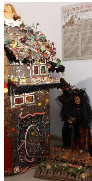
Museo de los Cuentos y la Ciencia, Paredes de Nava, Palencia