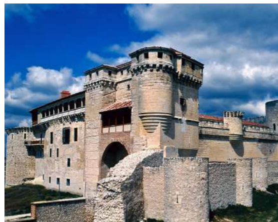
Castillo de Cuéllar, Segovia

Capital de una amplia comunidad de Villa y Tierra, se encuentra al noroeste de la provincia de Segovia, prácticamente equidistante entre su capital y Valladolid. Ubicada en "Tierra de Pinares", es una villa donde convivieron las tres culturas de la península: "judíos, moros y cristianos", como podemos apreciar por su judería, calle de la Morería, la Necrópolis musulmana de Santa Clara o sus iglesias. Cuéllar es un punto importante de arquitectura mudéjar con iglesias como la de San Andrés, San Pedro, San Esteban o San Martín. Además, su conjunto amurallado es uno de los más importantes de Castilla y León. De sus dos mil metros de longitud, se conservan aún unos mil trescientos metros. Pero también posee las tenerías, sus palacios, casas nobles y el Castillo de los Duques de Alburquerque. Éste ya aparece documentado en 1306 y su interior dispone de un patio con doble galería de arcos rebajados del siglo VXI, salones con sus decoradas techumbres, artesonados de estuco y vigas talladas. Como curiosidad, al fondo de "La Huerta del Duque", se encuentra el primer molino de viento documentado en Castilla y León, hacia el 1496. A destacar sus fiestas de Ntra. Sra. del Rosario y los encierros, declarados de Interés Turístico Internacional.