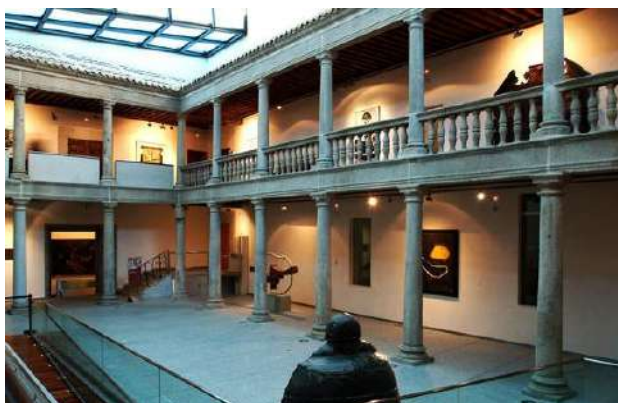
Palacio de los Serrano, Ávila