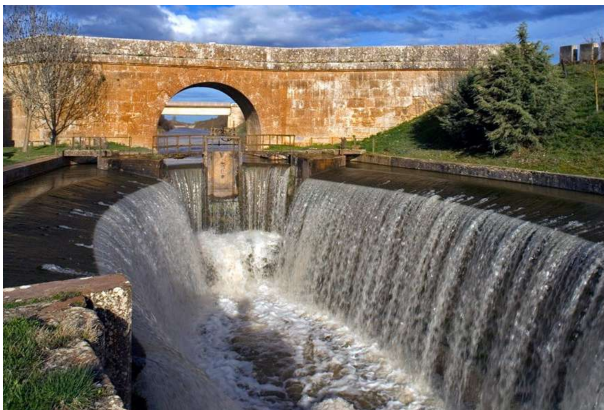
Esclusa del Canal de Castilla, Ribas de Campos, Palencia