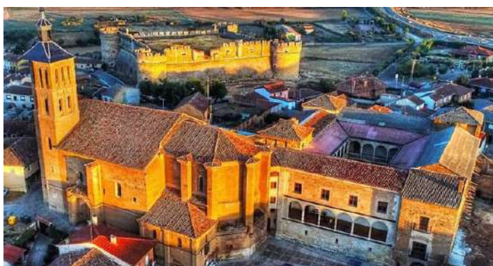
Grajal de Campos, León