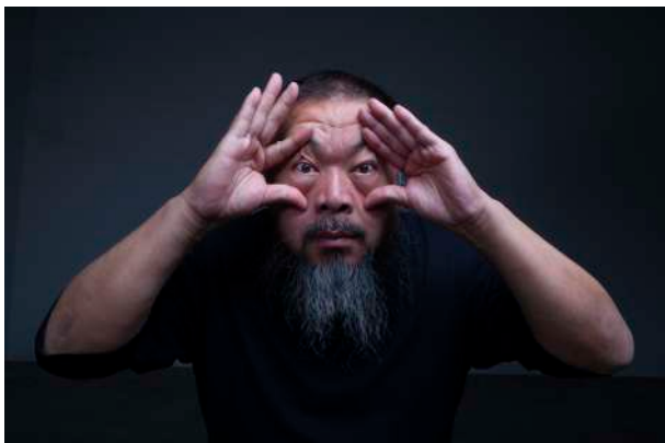
Ai Weiwei.

Esta exposición traza un amplio recorrido por una selección de trabajos realizados a lo largo de los últimos veinte años de la trayectoria de Ai Weiwei (Pekín, China, 1957), reconocido por su capacidad para fusionar arte y activismo político. Se incluyen aquí más de cuarenta obras entre instalaciones, vídeos y cuadros ejecutados con ladrillos de juguete. Se trata, además, de la primera muestra que exhibe en profundidad su serie de cuadros realizados con bloques de LEGO. Diecinueve obras en las que el artista parte de cuarenta colores para producir imágenes que recrean cuadros de la historia del arte o modifican fotografías procedentes de los medios de comunicación. Con respecto a ellas, el artista explica que LEGO, al igual que los diseños textiles y de alfombras, la impresión con tipos móviles de madera de la dinastía Song (ca. 1000 d.C.) o los mosaicos romanos antiguos, «encarna cierta sensación de atemporalidad».