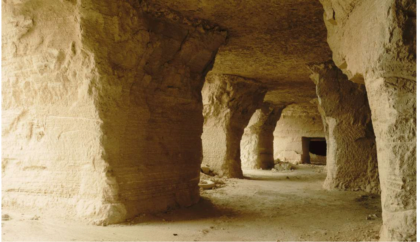
Minas de yeso de Hornillos de Cerrato, Palencia

La ruta norte recorre las provincias de León, Palencia y Burgos donde se podrá conocer el entorno paisajístico de Las Médulas, formado por la mayor mina de oro a cielo abierto del imperio romano, declarado Patrimonio Mundial por la Unesco; interesantes museos como el de la Energía, el del Petróleo, el de la Siderurgia y la Minería y varios museos Ferroviarios, también podremos adentrarnos en galerías mineras subterráneas donde apenas se veía la luz, algunas originales y otras, recreadas y acondicionadas para uso turístico. Para los amantes de la bici, las rutas BTT por las cuencas mineras serán todo un descubrimiento y el recorrido del tren minero de La Robla nos mostrará lugares interesantísimos.