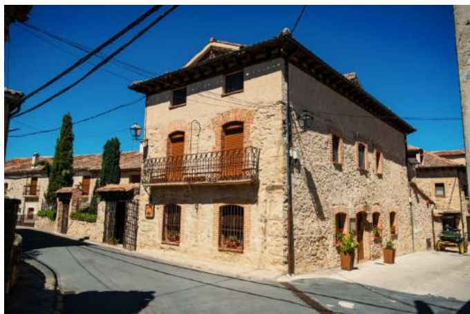
Posada Real Mingaseda, Navafría, Segovia