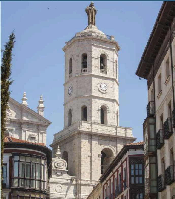
Torre Catedral de Valladolid

Valladolid es el lugar idóneo para el aprendizaje del español por su tradición humanística y cultural. La ciudad está estratégicamente localizada en el centro de la Comunidad Autónoma de Castilla y León. Cuenta con una amplia oferta académica, tanto pública como privada, para aprender castellano. Además, forma parte del Itinerario Cultural Europeo “Camino de la Lengua Castellana”, habiendo jugado un papel determinante en la difusión del castellano, dado que cuenta con una de las universidades más antiguas de España. Entre los principales hitos vinculados con el castellano destaca la fundación del Colegio de Santa Cruz en 1494 por el Cardenal Mendoza. La capital vallisoletana está estrechamente vinculada a la literatura a lo largo de la historia. Aquí nacieron José Zorrilla, Rosa Chacel, Miguel Delibes o Francisco Umbral, estudió Quevedo, y vivieron Santa Teresa de Jesús y Cervantes. Figuras que han divulgado por todo el mundo el castellano más puro. Además, la capital del Pisuerga goza de tener una excelente oferta de ocio y gastronomía, mundialmente conocidas son sus tapas y sus vinos.