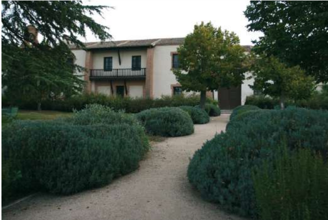
Posada Real Caserío de Lobones, Valverde del Majano, Segovia

Si buscas una experiencia de completa inmersión en la naturaleza y la autenticidad de Castilla y León, te recomendamos las Posadas Reales inuestra marca de calidad dentro del Turismo Rural! No sólo te alojarás en edificios singulares, sino que la excelencia del alojamiento y del trato están garantizadas! Una estancia perfecta para vivir una experiencia inolvidable y sumergirte en todas las actividades, patrimonio y naturaleza de Castilla y León.