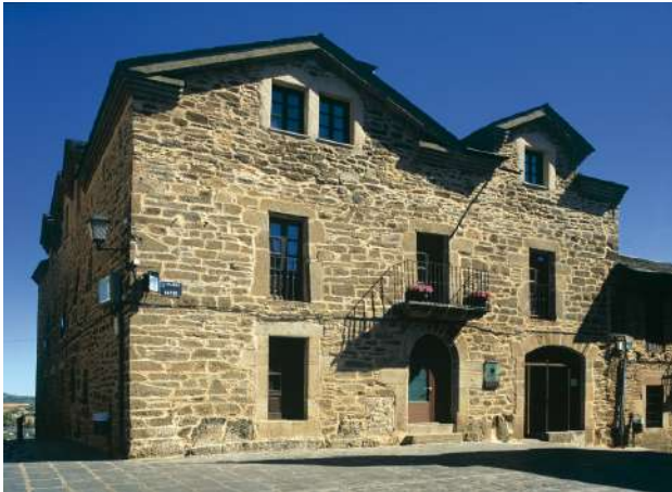
Posada Real de Las Misas, Puebla de Sanabria, Zamora

Si buscas una experiencia de completa inmersión en la naturaleza y la autenticidad de Castilla y León, te recomendamos las Posadas Reales inuestra marca de calidad dentro del Turismo Rural! No sólo te alojarás en edificios singulares, sino que la excelencia del alojamiento y del trato están garantizadas! Una estancia perfecta para vivir una experiencia inolvidable y sumergirte en todas las actividades, patrimonio y naturaleza de Castilla y León.