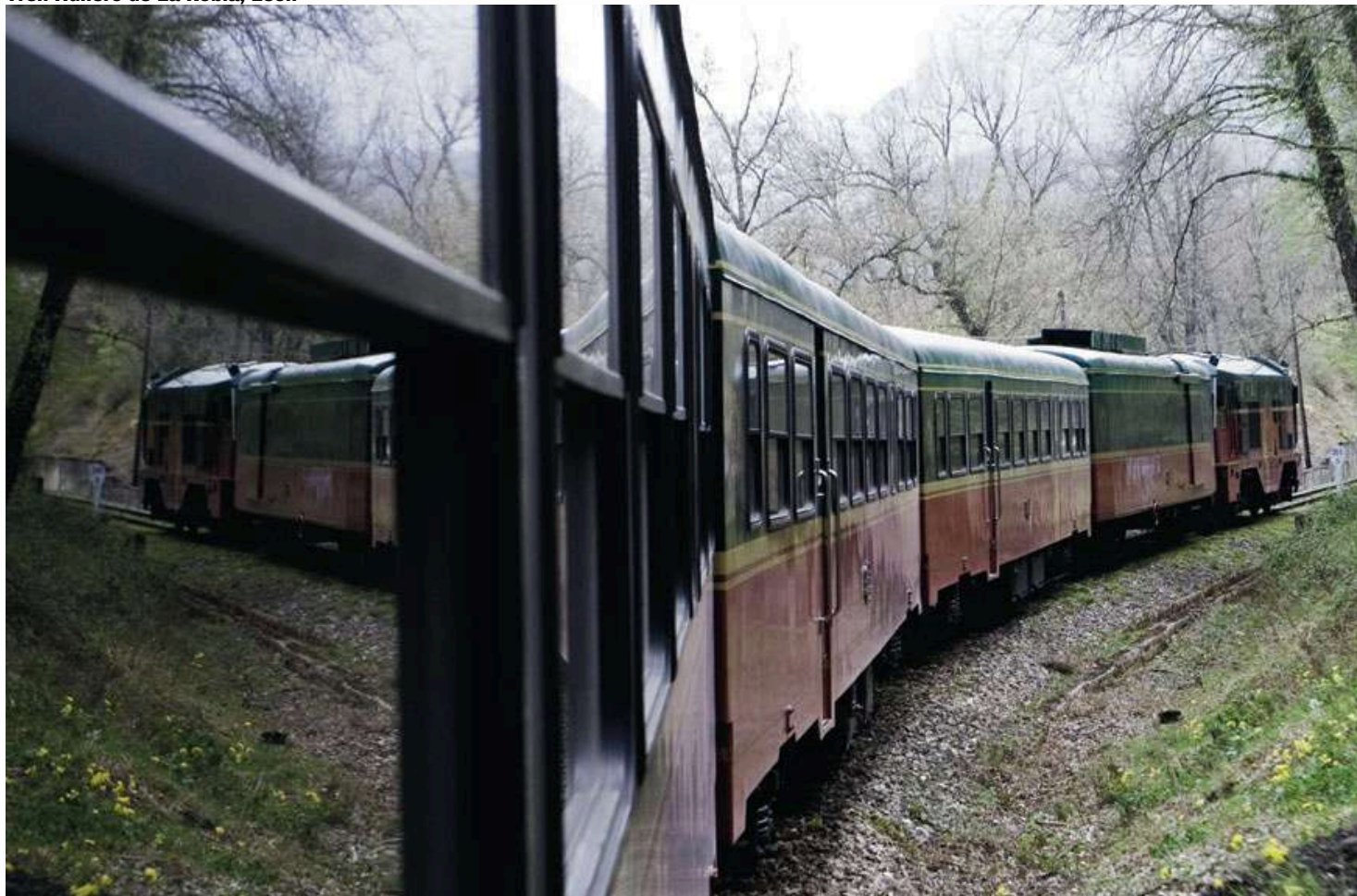
Tren Hullero de La Robla, León

El tren de La Robla fue construido en 1894 para trasladar la producción carbonífera desde las cuencas mineras de León y Palencia hasta la poderosa industria siderúrgica de Vizcaya. Además de carbón también transportaba pasajeros. Esta línea ferroviaria sufrió a lo largo de los años varias crisis y abandonos y, finalmente, en el año 2009 Renfe la recuperó para uso turístico con un recorrido de cuatro días.