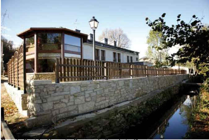
Posada Real La Yensula, Puente de Sanabria, Zamora

Si buscas una experiencia de completa inmersión en la naturaleza y la autenticidad de Castilla y León, te recomendamos las Posadas Reales inuestra marca de calidad dentro del Turismo Rural! No sólo te alojarás en edificios singulares, sino que la excelencia del alojamiento y del trato están garantizadas! Una estancia perfecta para vivir una experiencia inolvidable y sumergirte en todas las actividades, patrimonio y naturaleza de Castilla y León.