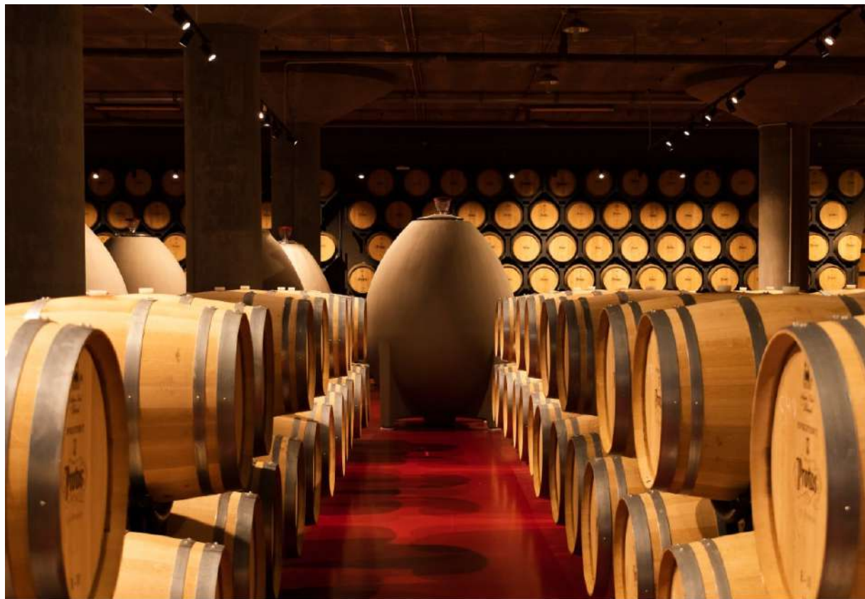
Bodega Protos, Valladolid