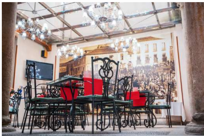
Posada Real Cinco Linajes, Arévalo, Ávila

Si buscas una experiencia de completa inmersión en la naturaleza y la autenticidad de Castilla y León, te recomendamos las Posadas Reales inuestra marca de calidad dentro del Turismo Rural! No sólo te alojarás en edificios singulares, sino que la excelencia del alojamiento y del trato están garantizadas! Una estancia perfecta para vivir una experiencia inolvidable y sumergirte en todas las actividades, patrimonio y naturaleza de Castilla y León.