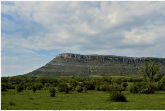
Monte Valonsadero