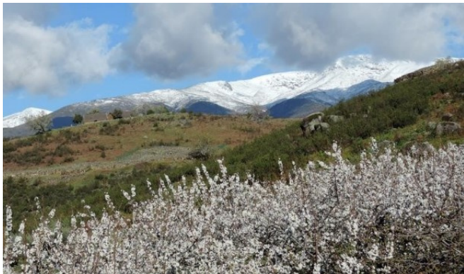
Cerezos en flor