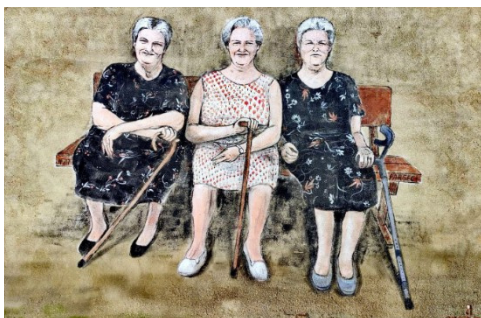
Pinturas en Castrogonzalo, Zamora

Castrogonzalo es un pequeño pueblo de menos de 500 habitantes que es un verdadero espacio de arte al aire libre. Esta localidad esconde una particularidad: los muros de sus calles están engalanados con murales y graffitis de todo tipo gracias a Antonio Feliz