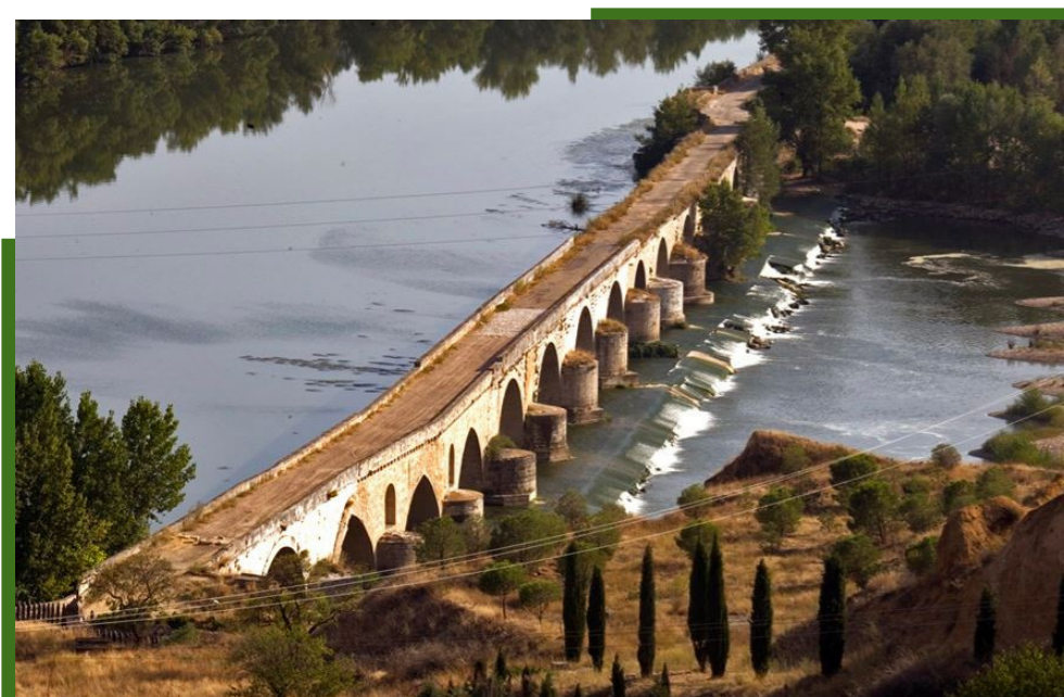
Río Duero y Puente Románico, Toro, Zamora