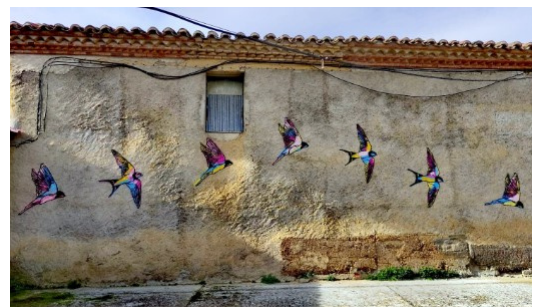
Pinturas en Castrogonzalo, Zamora

Recuerda que en Castilla y León lo encontrarás todo y más... ¡¡¡TE ESPERAMOS!!!