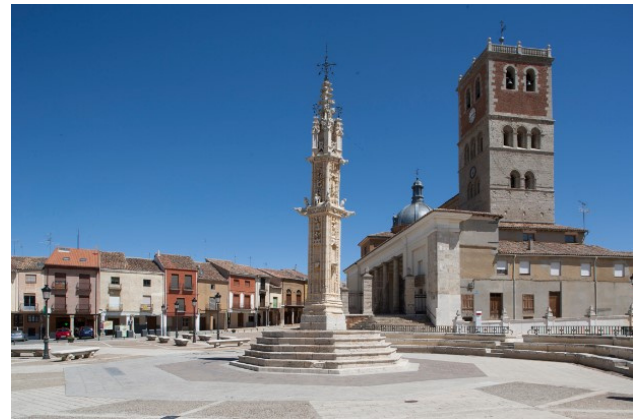
Villalón de campos, Valladolid

Mayorga cuenta con un patrimonio histórico muy importante donde predomina el estilo mudéjar, ejemplos como la iglesia de Santa María de Arbas construida en el siglo XIV, la iglesia de Santa Marina de finales del S. XV y la iglesia de Santa María del mercado de finales del S. XV también, son ejemplos de ello. Elemento significativo es el rollo de justicia del S. XVI, está formado por una esbelta columna de piedra sobre gradas circulares y consta de cuatro ménsulas rematado en un pequeño templete. Villalón de Campos es otro municipio de interés en la comarca terracampina, cuenta con tres templos donde destaca la iglesia parroquial de San Miguel Arcángel, gótico-mudéjar de los S.XIII-XIV. Por otro lado la iglesia de San Juan Bautista, iglesia gótica del S.XV y por último la iglesia de San Pedro, barroca del S.XVIII. En la plaza Mayor destaca el Rollo jurisdiccional con 10 metros de altura y construido en 1523. Tanto Mayorga como Villalón atesoran un patrimonio religioso y civil de indudable interés.