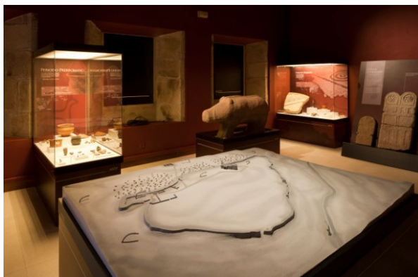
Yecla de Yeltes, Museo del Castro, Salamanca

A 2 Km. de Yecla de Yeltes se encuentra el castro prerromano de Yecla la Vieja. De origen vetón (siglo V a.C.), se asienta sobre una ladera fluvial y está reconocido como el vestigio amurallado más antiguo de los Arribes del Duero. Destaca su campo de piedras hincadas, la impresionante muralla, que en algunas zonas alcanzó los 5 metros de altura y 14 de anchura, y los petroglifos representando caballos. Fue un poblado de larga ocupación, ya que tras los vetones sería ocupado por sus descendientes hispanorromanos, conservándose numerosas estelas funerarias que pueden verse en el museo de la localidad, que también acoge uno de los verracos mejor conservados de la comunidad. El asentamiento se abandonó en el siglo XII por la nueva aldea de Yecla, aunque en época de los Reyes Católicos se levantó dentro del recinto la ermita de Nuestra Señora del Castillo, de estilo tardogótico.