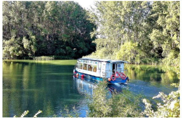
Barco Marqués de la Ensenada en Herrera de Pisuerga, Palencia

Actualmente puedes disfrutar del Canal dando un paseo en el barco Juan de Homar (desde Frómista hasta Boadilla del Camino, ida y vuelta), en el único tramo navegable del Camino de Santiago Francés, (Reservas Telf. 673 368 486) o bien en el barco Marqués de la Ensenada en Herrera de Pisuerga, haciendo un recorrido en el que salvarás una de las 49 esclusas de Canal. Además en verano hay animación teatral. (Reservas Telf. 664 201 415)