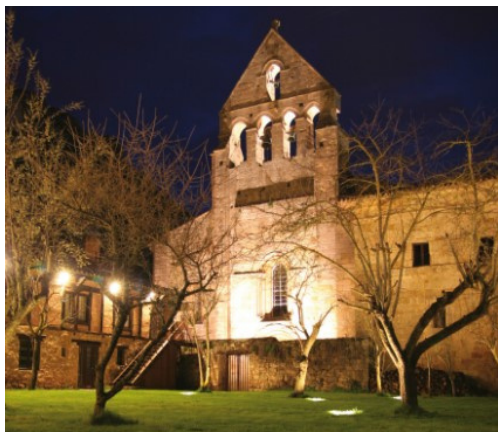
Posada Santa María La Real, Aguilar de Campoo, Palencia

Si buscas una experiencia de completa inmersión en la naturaleza y la autenticidad de Castilla y León, te recomendamos las Posadas Reales ¡nuestra marca de calidad dentro del Turismo Rural! No sólo te alojarás en edificios singulares, sino que la excelencia del alojamiento y del trato están garantizadas! Una estancia perfecta para vivir una experiencia inolvidable y sumergirte en todas las actividades, patrimonio y naturaleza de Castilla y León.