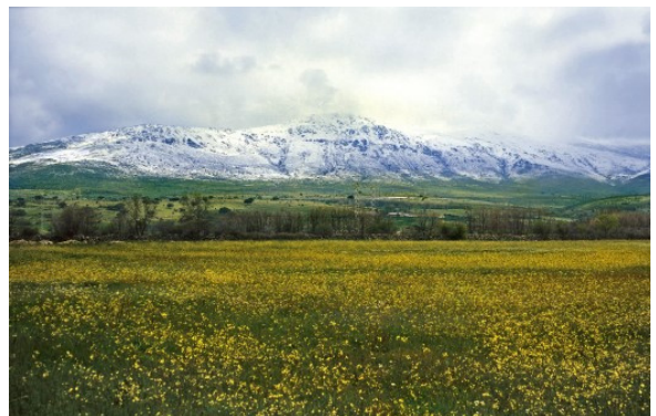
Sierra de Guadarrama, Segovia

Ubicado en la vertiente norte de la Sierra de Guadarrama, está formado por varios núcleos de población: El Espinar, San Rafael y La Estación. Además de su riqueza natural, de la que hablaremos más adelante, tiene una riqueza monumental en la que, entre sus diversas ermitas y palacios, destaca la iglesia de San Eutropio, con su impresionante retablo de Francisco Guiralte y su hermosa sarga para vestir de luto el Retablo Mayor en Semana Santa, de Sánchez Coello. Formado por una diversidad de paisajes y ecosistemas, nos ubicamos en pleno Parque Nacional de la Sierra de Guadarrama. Una extensa red de senderos donde podremos disfrutar del pino, el robledal, encinas... Con una amplia variedad de flora y fauna que nos permitirá disfrutar en el recorrido de dos Cañadas Reales, dos senderos de Grandes Recorridos y dos etapas del Camino Natural de la Cañada Real Soriana Occidental, entre otras rutas. No puedes perderte la oportunidad de disfrutar de más de 700 cigüeñas que visitan cada año este pueblo.