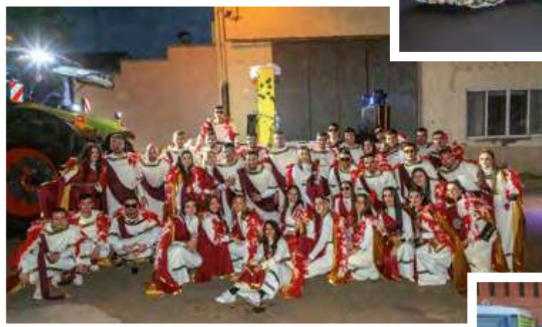
DE BAR EN PEOR