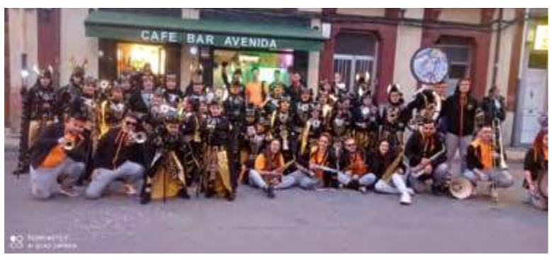
LA ALEGRIA DE LA HUERTA