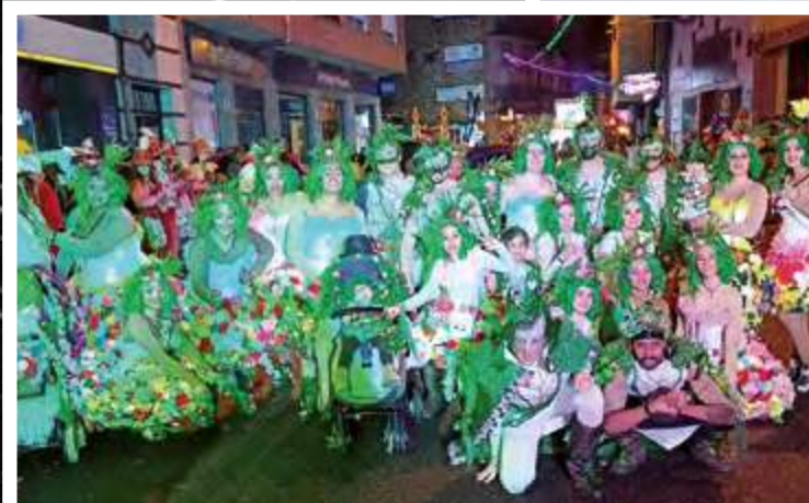
GRUPO LOS LATINOS