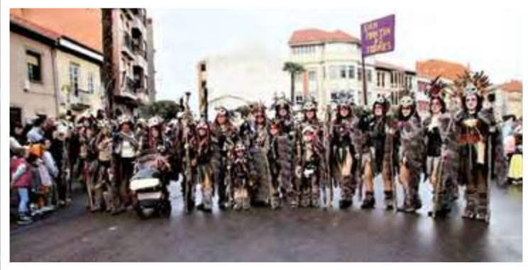
SAN MARTIN DE TORRES