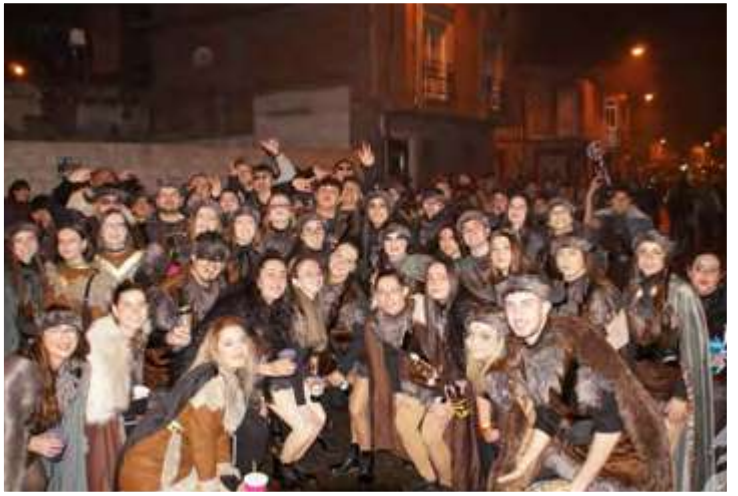
NI FU NI FA