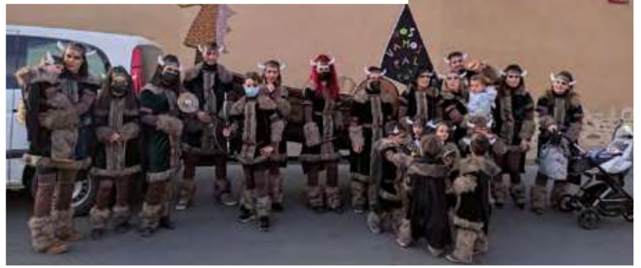
NOS VAMOS PAL PUEBLO