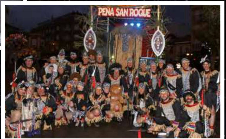
PEÑA SAN ROQUE