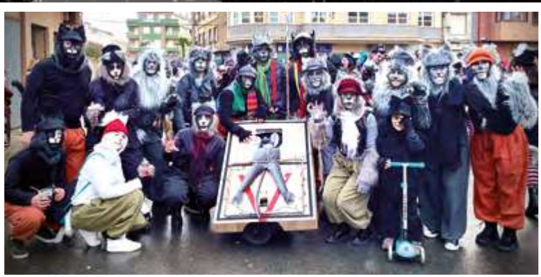
LOS DE SIEMPRE