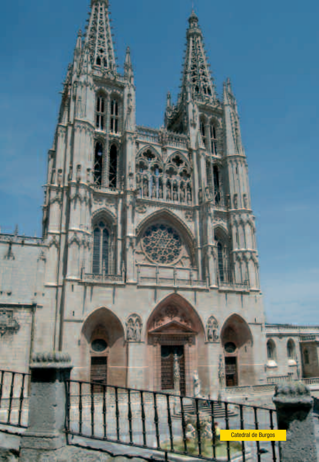
Catedral de Burgos