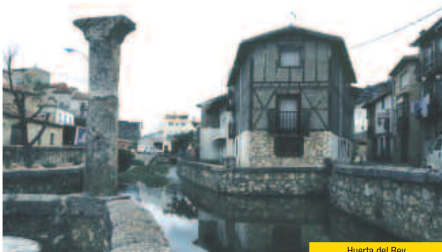
Huerta del Rey

La población de HINOJAR DEL REY , pedanía que