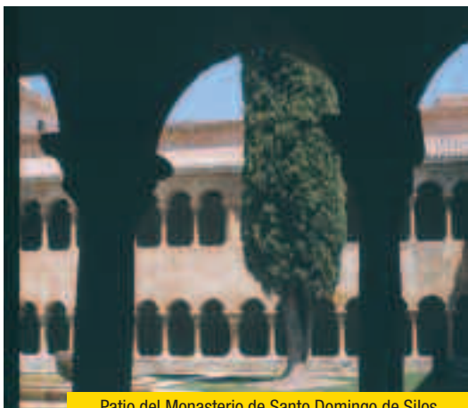
Patio del Monasterio de Santo Domingo de Silos

El trazado continúa hasta HUERTA DEL REY , ayuntamiento al que pertenecen las pedanías de Hinojar, Peñalba de Castro y Quintanarraya. El pueblo está rodeado de un frondoso bosque de pinos, mientras que la población conserva un casco urbano y una arquitectura popular de entramado de madera que le confieren como un lugar pintoresco. El nombre del lugar está relacionado con la fertilidad de su tierra mientras que el apellido se vincula a la donación hecha por Alfonso VII, rey de Castilla y León e hijo de la reina Doña Urraca, en el año 1137 al Monasterio de Silos tanto de Huerta como de su castillo. A partir del siglo XIV aparece en la documentación bien como “Huerta del Rey” bien como “Huerta de Rey”, aunque abunda más la última. Entre su caserío destaca su iglesia de San Pedro , de estilo neoclásico y dotada de unos bellos retablos y una magnífico altar, y las ermitas de Santa María o de Los Remedios y la de San Roque .