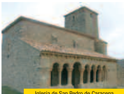
Iglesia de San Pedro de Caracena

Los municipios de CARRASCOSA DE ABAJO, FRESNO DE CARACENA , en el que destaca su rollo jurisdiccional, INÉS , villa en la que aún