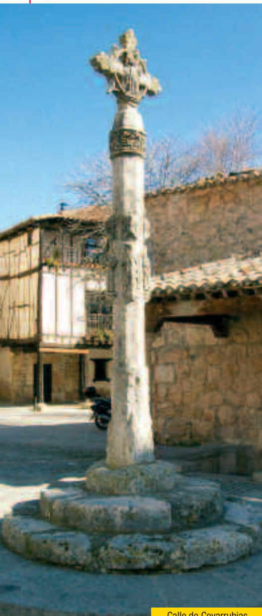
Calle de Covarrubias

dispone de un más que interesante conjunto monumental en el que se pueden apreciar restos de murallas, casas blasonadas y edificios religiosos entre los que destaca sobremanera el monasterio de Santo Domingo de Silos (Bien de Interés Cultural) . El primer documento conservado que hace referencia a este cenobio data del año 954. La prosperidad que llegó a alcanzar el monasterio se debe en gran medida a la persona que posteriormente dará nombre al lugar, Santo Domingo de Silos, quien se instaló aquí en el año 1041 tras dejar su cargo de prior en San Millán de la Cogolla. La figura del abad de Silos cobró tanta fuerza que tras su fallecimiento el lugar se convirtió en un centro de peregrinación debido a los milagros que el Santo realizó.