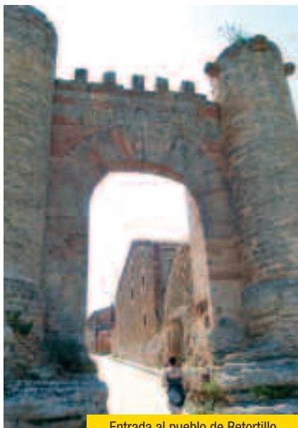
Entrada al pueblo de Retortillo

esta ruta recorre un total de 157 kilómetros atravesando las provincias de Soria y Burgos. La primera localidad castellano y leonesa a la que se accede es Retortillo de Soria. Desde esta población hasta la capital burgalesa un buen número de localidades por las que atraviesa esta senda coinciden en su itinerario con el conocido como Camino del Cid , la ruta que el legendario Rodrigo Díaz de Vivar tomó en su destierro ordenado por el rey Alfonso VI, a finales del año 1080, desde tierras castellanas hasta la capital del Turia, Valencia.