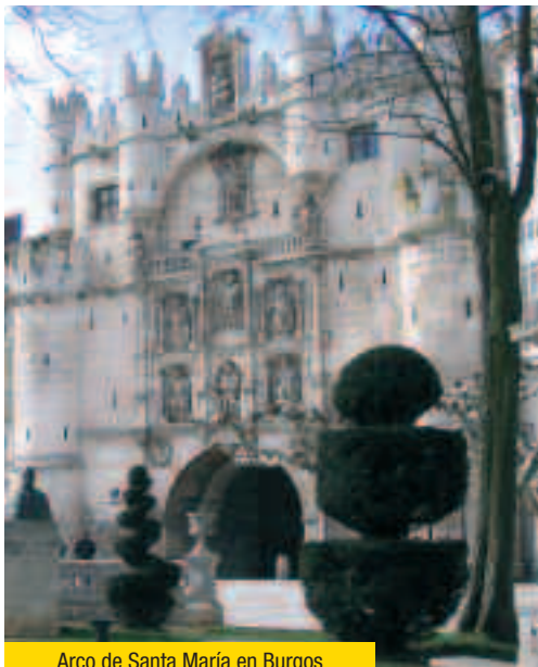
Arco de Santa María en Burgos

retablo de tipo churrigueresco con columnas salomónicas. La patrona de la localidad es la Virgen del Camino, a la que se construyó una ermita nueva tras la demolición de la original. Merece la pena visitar el monumento en honor al Cid Campeador, que atravesó estas tierras durante su destierro a Valencia, y el Dolmen de Cubillejo de Lara o de Mazariegos, de la Edad de Bronce y con grabados rupestres que representan de forma esquemática figuras animales y un signo de tipo solar.