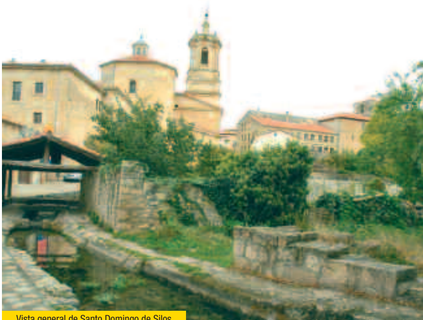
Vista general de Santo Domingo de Silos

La siguiente población supone todo un hito en este Camino y, como tal, el peregrino deberá hacer un alto para descubrir la histórica villa de SANTO DOMINGO DE SILOS . Esta localidad posee vinculación directa con la historia del castellano ya que aquí se escribieron las Glosas Silenses , consideradas como unas de las primeras manifestaciones escritas en castellano. La población, situada en la ribera del río Mataviejas o Ura,