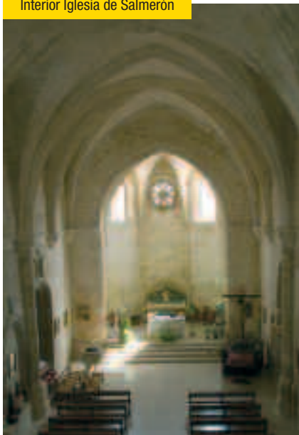
Interior Iglesia de Salmerón

iglesias, monasterios, conventos y otros inmuebles de tipo civil. Entre ellos caben citarse dentro de la arquitectura civil el edificio de El Almudí (s. XVI) destinado a Pósito Real, el punto de San Pablo , el Punto de San Antón , la Posada de San Julián , la Torre de Mangana , el Tribunal de la Inquisición .