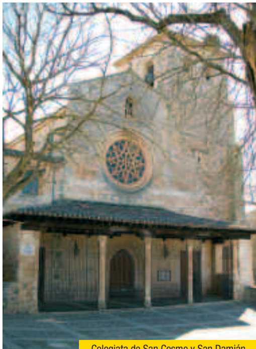
Colegiata de San Cosme y San Damián

La villa medieval de COVARRUBIAS es uno de los mejores ejemplos de la arquitectura popular castellana y de ahí su declaración como Conjunto Histórico Artístico (Bien de Interés Cultural) . En el siglo X, el primer conde independiente de Castilla, Fernán González y su hijo, el conde García Fernández, convertirán a esta localidad de la Comarca del Arlanza en capital del primer Infantado de Castilla y cabeza de uno de los señoríos monásticos más importantes. El peregrino y el turista no debe perderse la visita del crucero del siglo XV y del archivo del Adelantamiento de Castilla (siglo XVI). Destaca también la torre de Doña Urraca (Bien de Interés Cultural) , torreón donde se dice que fue emparedada por su propio padre, Fernán González. La Colegiata de San Cosme y San Damián (Bien de Interés Cultural) , edificio del siglo XV en cuyo interior alberga un claustro del XVI en donde se puede apreciar la tumba de la princesa Cristina de Noruega, esposa del infante