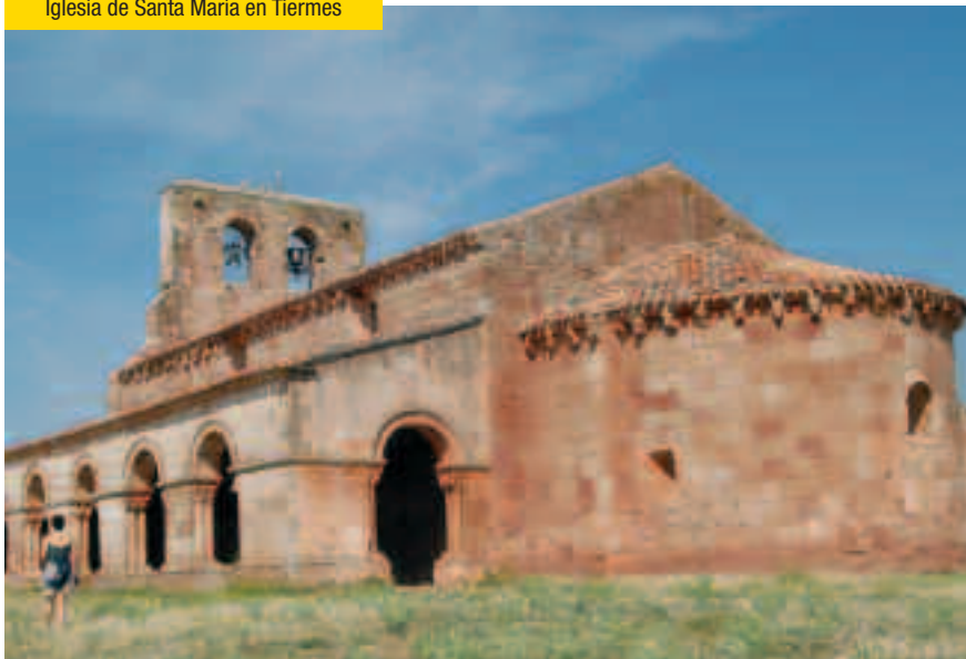
Iglesia de Santa María en Tiermes

el río Caracena, llegamos al municipio que toma el nombre del cauce fluvial, CARACENA . Es esta una pequeña localidad cuyo emplazamiento es muy atractivo por sus paisajes y por los monumentos que aún conserva, especialmente su rollo de justicia (Bien de Interés Cultural) del siglo XVI y estilo renacentista, las iglesias románicas de Santa María y la de San Pedro (Bien de Interés Cultural) . En la primera destacan sus dos ventanas como los únicos elementos de iluminación del templo y situadas en el centro del ábside y en el paramento occidental. Por lo que respecta al templo de San Pedro en él destaca sobremedida su galería donde el mayor atractivo artístico se encuentra en sus elaborados capiteles. De gran interés son los restos del castillo (Bien de Interés Cultural) reedificado a finales del siglo XV por mandato de Alfonso Carrillo de Acuña. A esta época corresponden las troneras de los muros concebidas para una mejor defensa de la fortaleza.