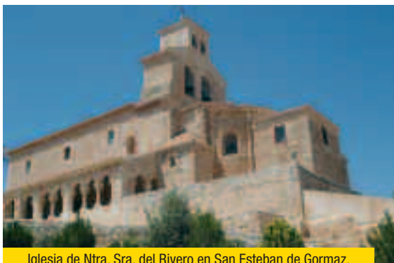
Iglesia de Ntra. Sra. del Rivero en San Esteban de Gormaz.

queda por restaurar su iglesia de Nuestra Señora de la Asunción quemada a consecuencia de un rayo en el año 1974, y OLMILLOS dan paso a la localidad de SAN ESTEBAN DE GORMAZ , una de las más relevantes de este Camino.