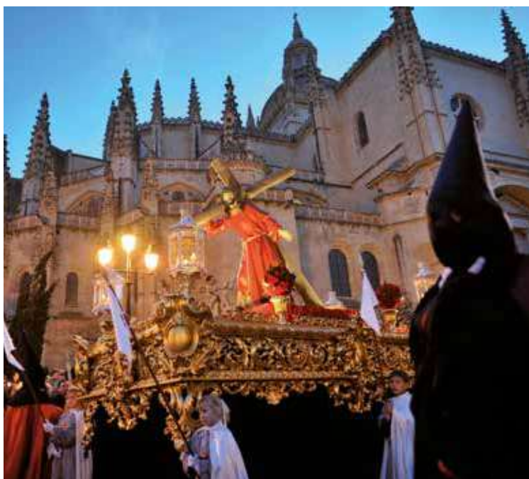
Semana Santa de Segovia.

Castilla y León cuenta con más de un centenar de fiestas declaradas de interés turístico regional, nacional e internacional.