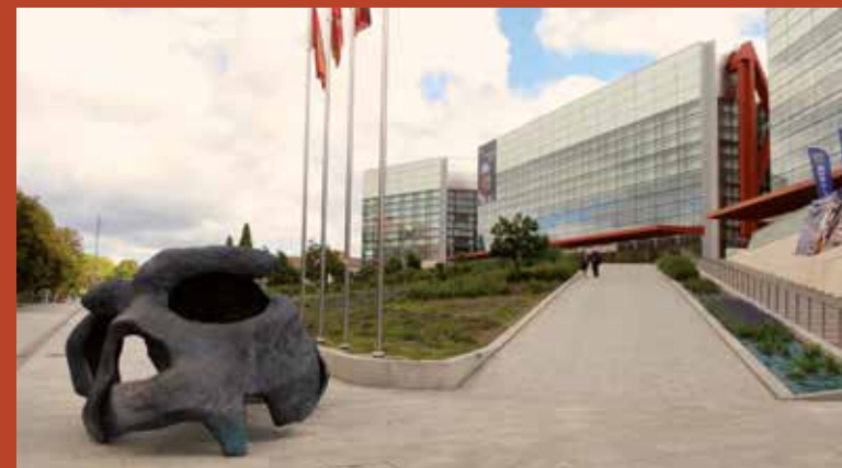
Entrada al Museo de la Evolución Humana.

Las principales ciudades de Castilla y León cuentan con infraestructuras públicas y privadas y disponen, además, de Oficinas de congresos que facilitan toda la información para la organización de los mismos.