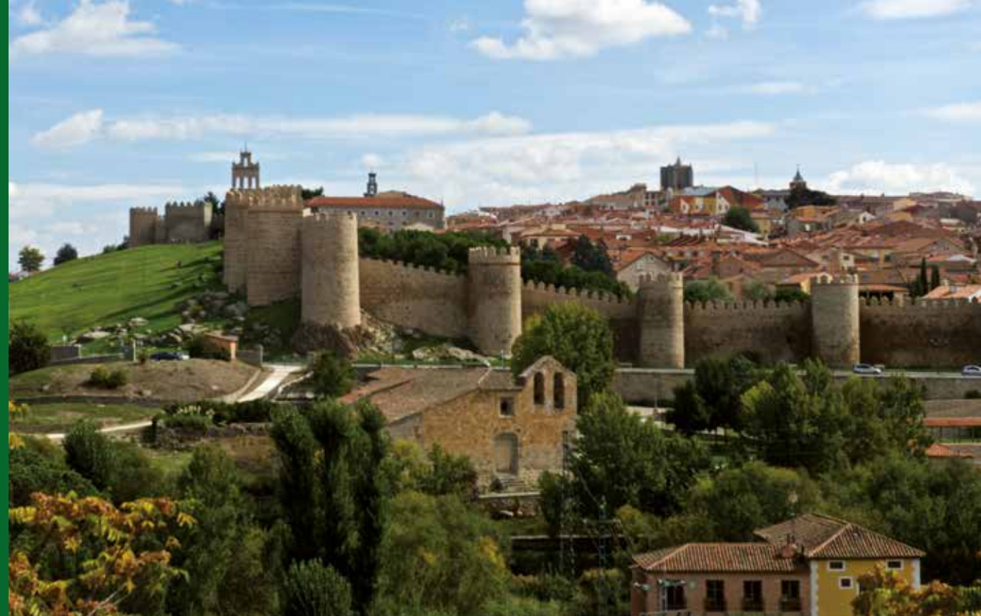
Vista panorámica de Ávila.

Cuatro aeropuertos y la inmediatez en el acceso al aeropuerto de Adolfo Suárez-Barajas completan las infraestructuras de una Comunidad bien comunicada con su entorno. La cordialidad y amabilidad de sus gentes han convertido a Castilla y León en una tierra abierta al resto del mundo tanto en el pasado como en el presente. Quien se acerca a estas tierras, es bien recibido y encuentra motivos sobrados para integrarse en una sociedad dinámica, rica y acogedora.