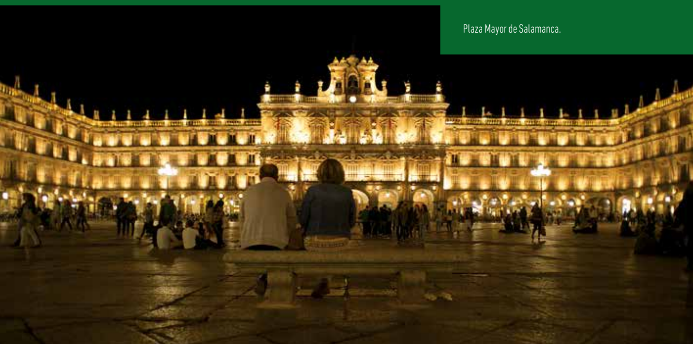
Plaza Mayor de Salamanca.

red nacional de ferrocarriles y por ella se desarrolla la mayor parte del tránsito ferroviario de la mitad norte de España. Además Castilla y León es el destino de España que tiene mayor número de ciudades conectadas con Madrid mediante trenes de alta velocidad.