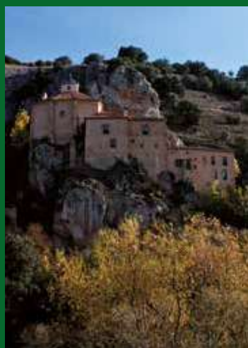
Ermita de San Saturio, Soria.

Castilla y León, cuna y residencia de ilustres personajes de la historia, ha sido para España y para Europa un ejemplo de respeto, convivencia, diálogo en la diversidad y de interculturalidad a lo largo de sus siglos de historia.