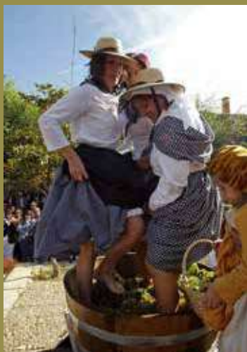
Celebración de la Fiesta de la Vendimia en Rueda, Valladolid.