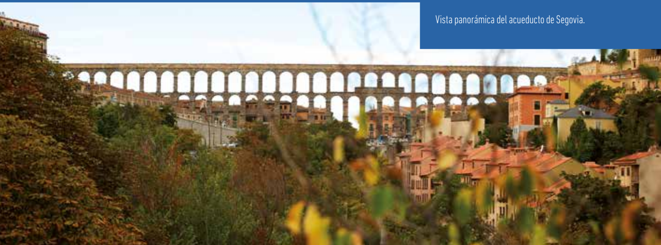
Vista panorámica del acueducto de Segovia.

religiosas y civiles, confieren a la ciudad un atractivo aspecto y su innegable valor cultural. En alguna de sus calles y edificios es aún posible percibir la convivencia de las culturas judía, musulmana y cristiana. Cada año la ciudad de Segovia celebra en sus calles una interesante muestra de actividades culturales y turísticas que atraen un buen número de visitantes.