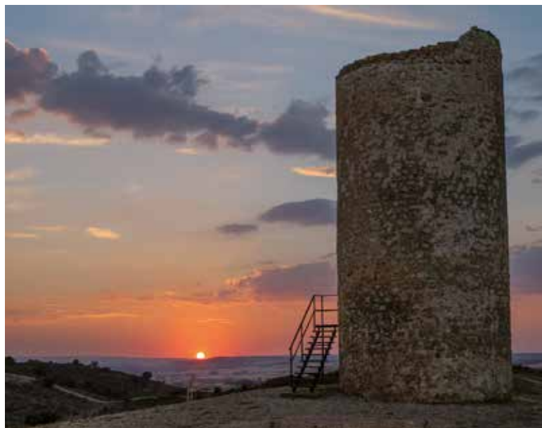
Vista panorámica de Segovia.

Atalaya defensiva musulmana de Quintanilla de los Barrios. Cerca de San Esteban de Gormaz. Soria.