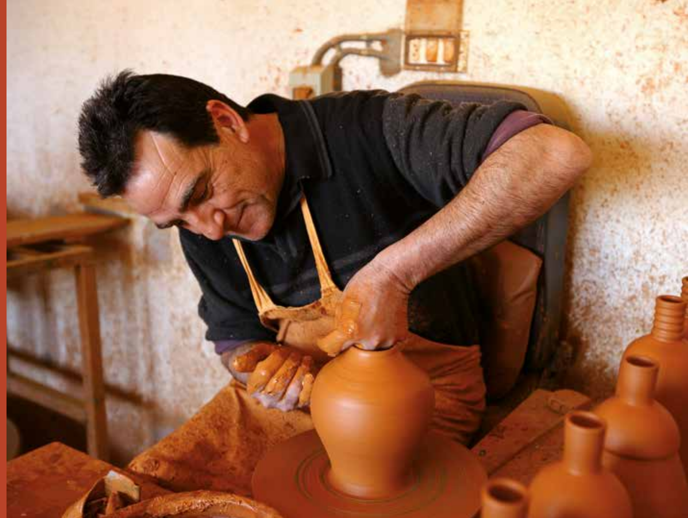
Alfarero en el taller.