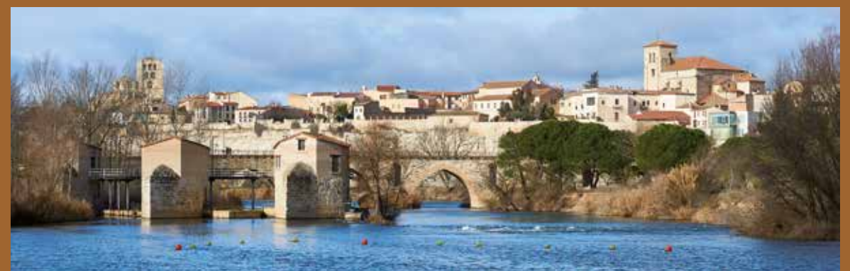
El río Duero a su paso por Zamora, con las Aceñas de Cabañales en primer plano.

La ruta del Duero es uno de los ejes culturales más importantes del sur de Europa. Su recorrido permite al viajero atravesar espacios naturales convertidos en reservas medioambientales y faunísticas.