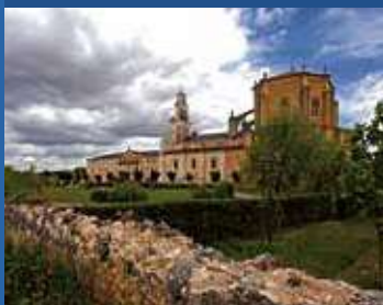
Monasterio de Santa María de la Vid (Burgos).

Los monasterios fueron antaño refugio de peregrinos, hoy reconvertidos en espacios donde el viajero puede encontrar el ambiente de religiosidad con el que fueron creados.