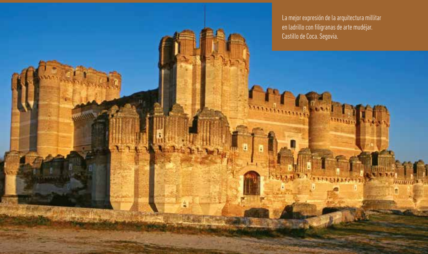
La mejor expresión de la arquitectura militar en ladrillo con filigranas de arte mudéjar. Castillo de Coca, Segovia.