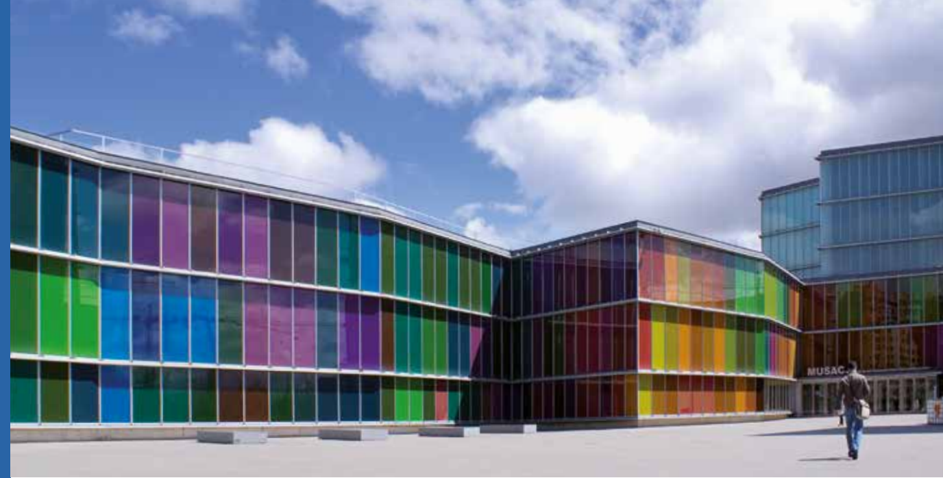
Museo de Arte Contemporáneo - MUSAC. León.

Las aulas arqueológicas que se reparten por Castilla y León son la mejor presentación de la riqueza arqueológica de la Comunidad.