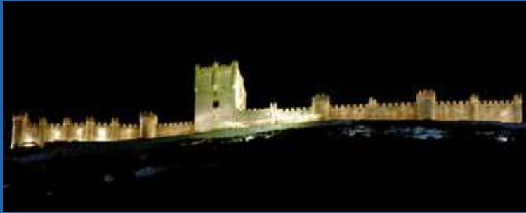
Castillo de Peñafiel

Actualmente, existen interesantes rutas que ayudan a descubrir su historia, arquitectura, y la importancia que tuvieron siglos atrás.