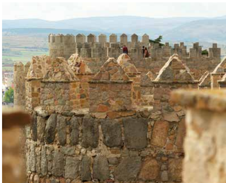
Las murallas de la ciudad de Ávila vistas desde las almenas.

Ávila cuenta con una muralla con 87 torreones y 2000 almenas. Su principal tramo visitable, de 1200 m, une la casa de las Carnicerías con el Puente Adaja.