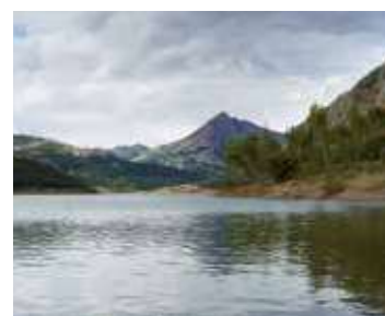
Pantano de Boñar. León.