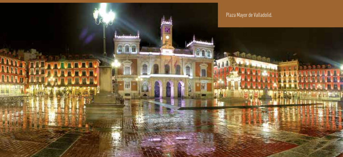
Plaza Mayor de Valladolid.

Santo Domingo de Silos tiene una vinculación directa con la historia del castellano ya que aquí se escribieron las Glosas Silenses, una de las primeras manifestaciones escritas en castellano.