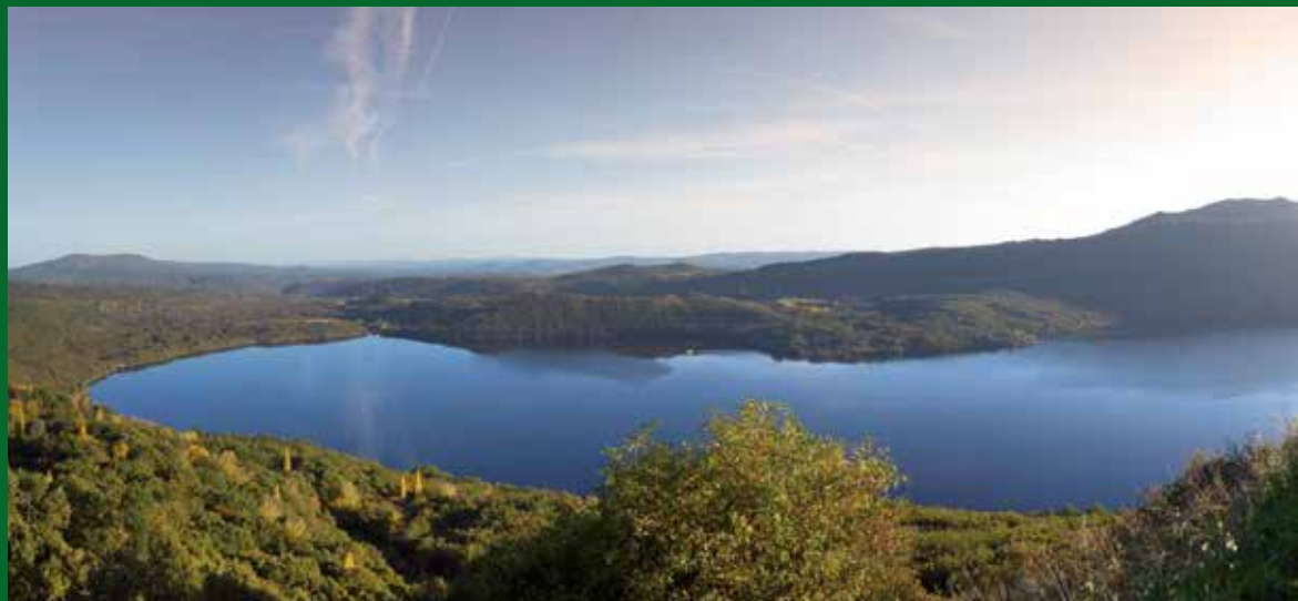
Lago de Sanabria, Zamora.