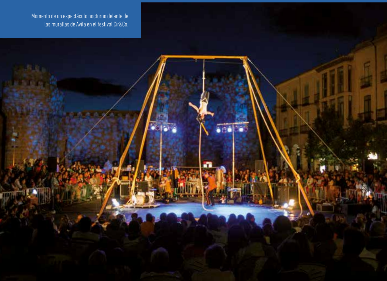
Momento de un espectáculo nocturno delante de las murallas de Ávila en el festival Cir&Co.

Semana Internacional de Cine de Valladolid. En octubre de cada año se celebra en Valladolid una muestra cinematográfica que se posiciona como uno de los principales festivales de cine internacional de España, destacando en el área del cine de autor e independiente y que ha ido evolucionando desde su creación en 1956 como Semana de Cine Religioso de Valladolid realizada durante la Semana Santa.