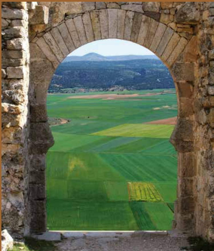
Puerta Califal del castillo de Gormaz, Soria.

Desde sus orígenes, este itinerario se ha identificado tradicionalmente con el recorrido seguido por el Cid en el Cantar, obra tomada como principal referencia a la hora de diseñar los trazados de la Ruta.