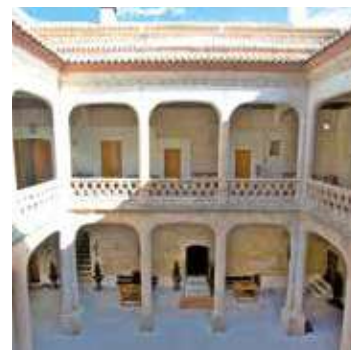
Posada Real Castillo del Buen Amor. Topas, Salamanca.