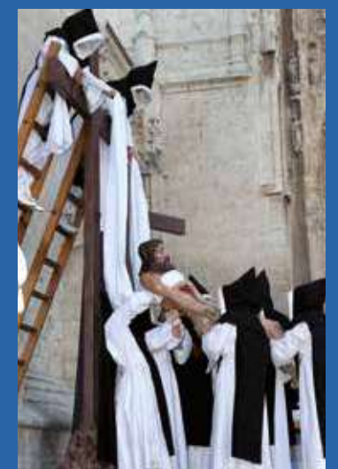
Semana Santa de Palencia.

arraigo y atractivo turístico. Castilla y León es la Comunidad española que cuenta con mayor número de Semanas Santas declaradas de interés turístico internacional. Éstas son: Ávila, León (La Ronda y Procesión de los Pasos), Medina del Campo, Medina de Rioseco, Palencia, Salamanca, Valladolid y Zamora.