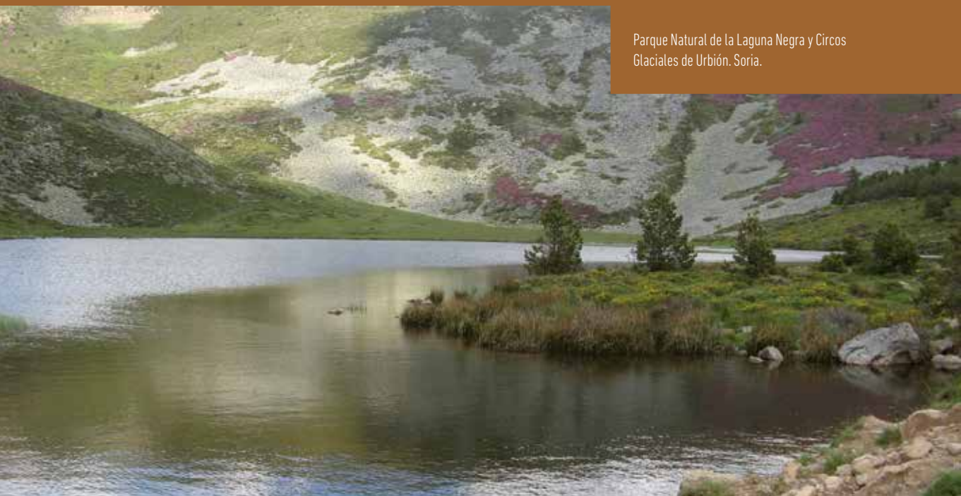
Parque Natural de la Laguna Negra y Circos Glaciales de Urbión. Soria.

Castilla y León tiene designado por la UNESCO el Geoparque de Las Loras, primer geoparque de Castilla y León, que ocupa parte de la zona norte de las provincias de Burgos y Palencia. Su patrimonio geológico en particular, junto con el resto del patrimonio natural y cultural le ha valido esta distinción.