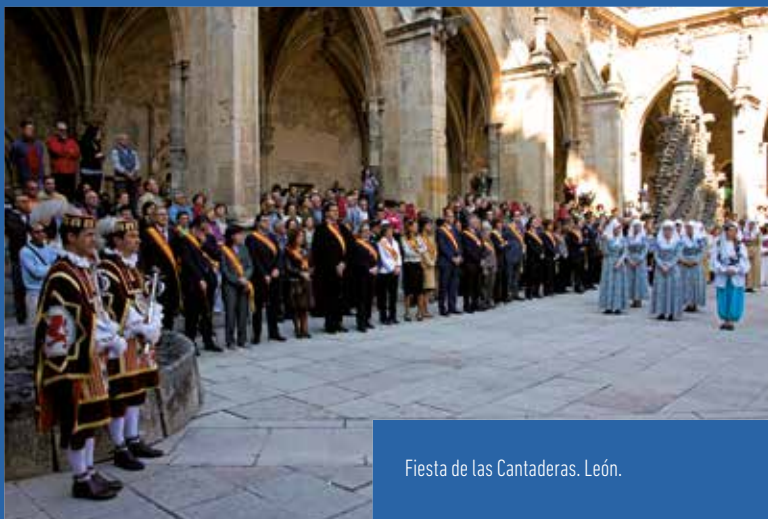
Fiesta de las Cantaderas. León.

Tradiciones y costumbres para el recuerdo, pero también para ser vividas y disfrutadas en el presente. Fiestas de la vendimia, encierros, romerías y desfiles, carnavales y mascaradas, justas medievales, música y bailes al ritmo de la dulzaina, del tambor y de otros instrumentos tradicionales y modernos inundan toda la geografía de la Comunidad.