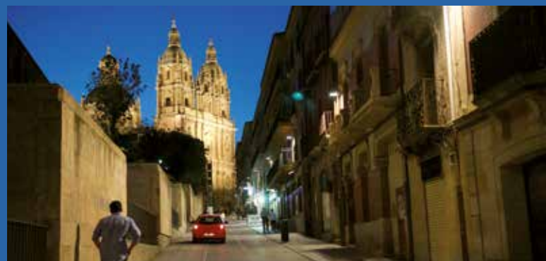
Calles de Salamanca con el edificio de la Clerecía (Universidad Pontificia) al fondo.

Es una de las cuatro más antiguas de Europa junto con Bolonia, Oxford y París. Su origen está en las escuelas catedralicias de época medieval, en el siglo XII y ya en el siglo XVII era considerada una universidad prestigiosa.