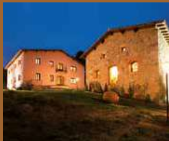
Posada del Infante Arenas de San Pedro (Ávila)

Castilla y León es la Comunidad Autónoma líder en turismo rural en número de establecimientos. Además, cuenta con una marca de calidad de los establecimientos de turismo rural denominada Posadas Reales que reúne a los mejores alojamientos rurales repartidos por los más bellos rincones de la Comunidad.