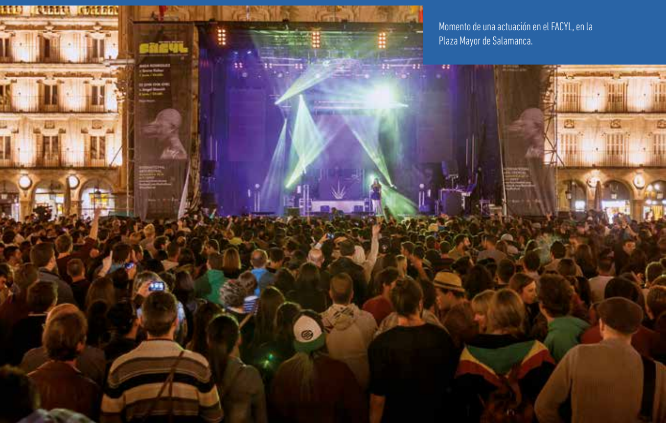
Momento de una actuación en el FACYL, en la Plaza Mayor de Salamanca.

Los escenarios de Facyl acogen espectáculos de hip hop, breakdance, danza contemporánea, circo, teatro o recitales de poesía. Todas las disciplinas artísticas tienen su espacio en el Festival.