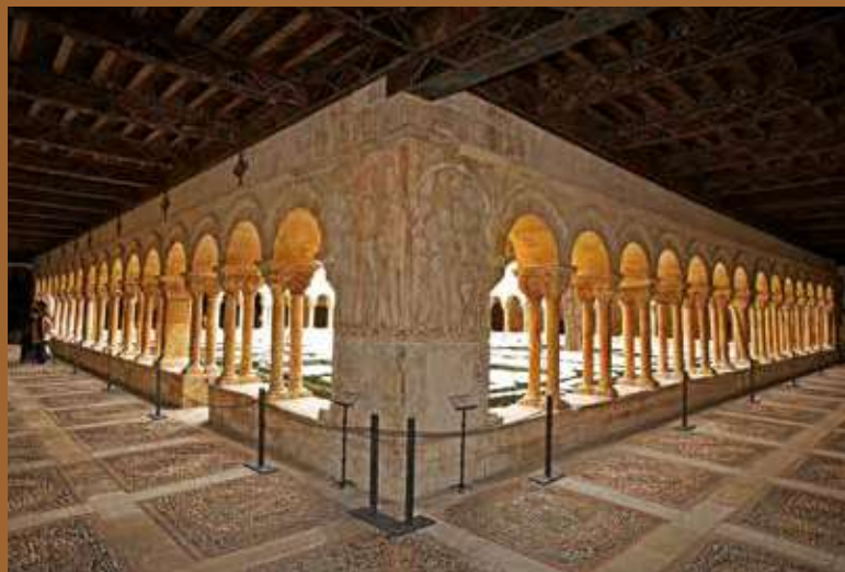
Claustro del Monasterio de Santo Domingo de Silos. Burgos.