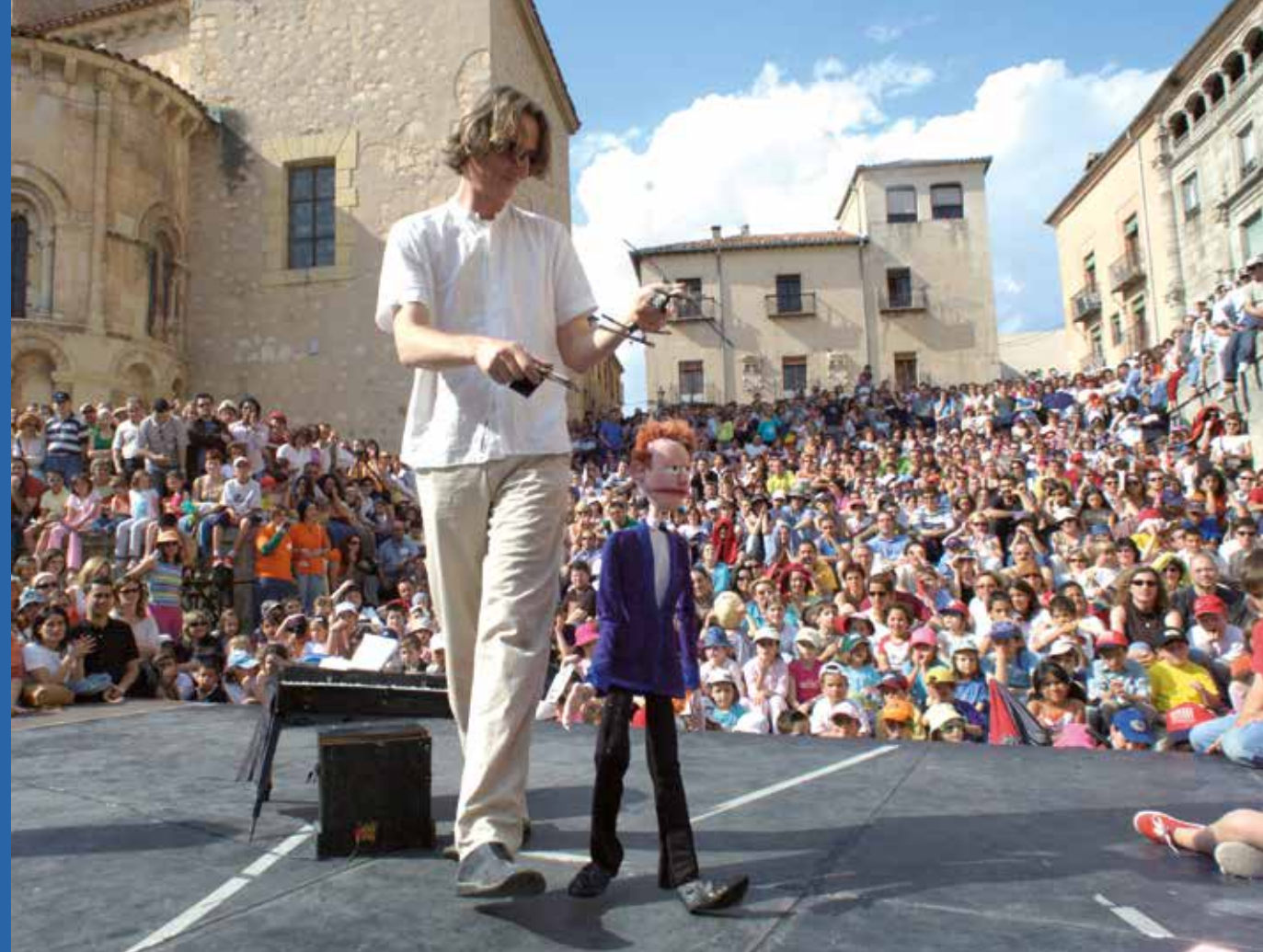
Actuación del Festival Titirimundi. Segovia.