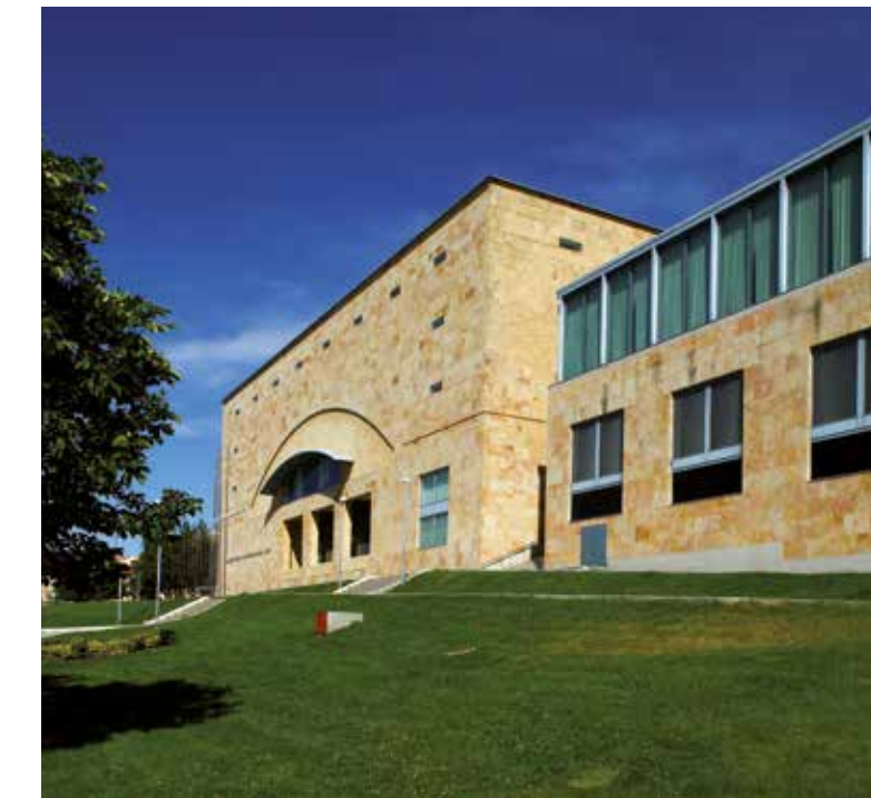
Palacio de congresos y exposiciones de Castilla y León. Salamanca.