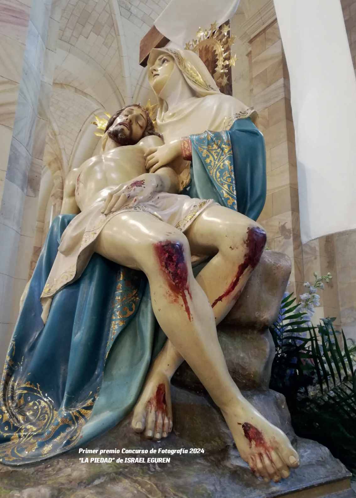
Primer premio Concurso de Fotografía 2024 "LA PIEDAD" de ISRAEL EGUREN