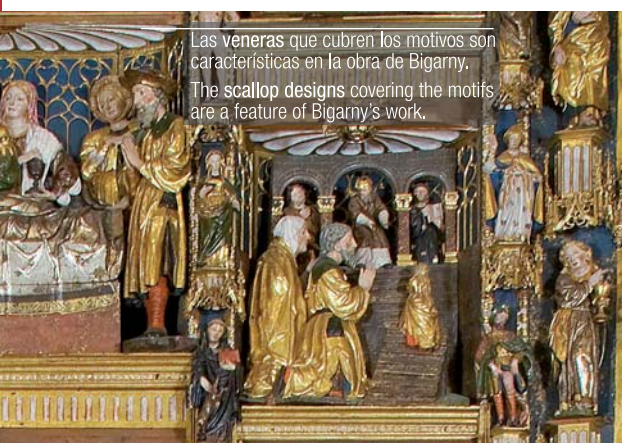
Las veneras que cubren los molinos son características en la obra de Bigarny. The scallop designs covering the mills are a feature of Bigarny's work.

Annunciation scenes in altarpieces in Burgos made by Bigarny's workshops