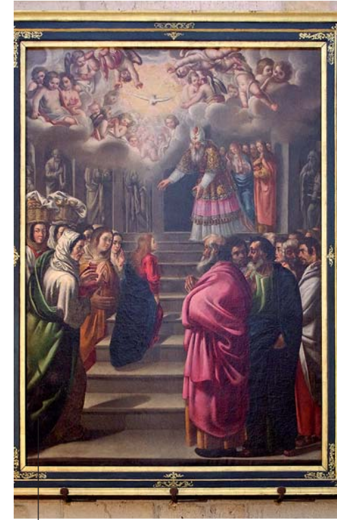
La Presentación de Nuestra Señora, óleo de 1,5 m de anchura de autor desconocido que da nombre a la capilla.

Capilla de los Lerma o de la Presentación, en la catedral de Burgos. El retablo mayor que luce actualmente es neoclásico (c1750). Su primer retablo, renacentista, es el que realizó Felipe Bigarny (c1528) y está en la iglesia de Cardedeña Riopico.