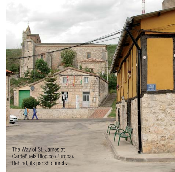
El Camino de Santiago nos vuelve a sorprender a su paso por la Sierra de Atapuerca, en Cardedeña Riopico, a escasos 13 km de la ciudad de Burgos.

The church of Santa Eulalia of Mérida at Cardedeña Riopico is home to a rare altarpiece made between 1526 and 1529 by the great sculptor Felipe Bigarny for the Presentation Chapel in the cathedral of Burgos. It was sold by the chapter to this parish church in 1750.