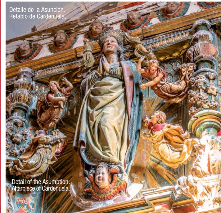
Detalle de la Asunción, Retablo de Cardedeña.