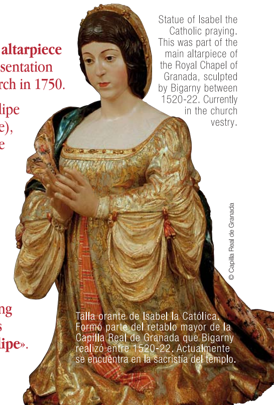
Statue of Isabel the Catholic praying. This was part of the main altarpiece of the Royal Chapel of Granada, sculpted by Bigarny between 1520-22. Currently in the church vestry.

Outside of Burgos he worked most notably for Cardinal Cisneros in the cathedral of Toledo and on the altarpiece of the Chapel of the Catholic Monarchs in Granada. Bigarny had an extensive network of imagery workshops all over Spain, which allowed him to cater to his distinguished clients' needs. His capacity for combining the gothic tradition with the new trends of the renaissance and the beauty of his sculptures earned him a strong reputation, along with the nickname « Master Felipe ». He passed away in Toledo in 1542 and was buried in the cathedral.