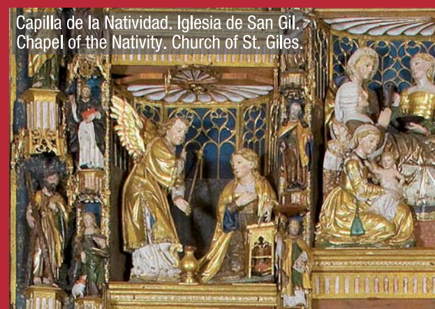
Escenas de La Anunciación realizadas por los talleres de Bigarny en distintos retablos burgaleses