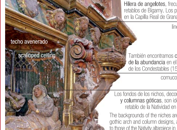
Hileras de angelotes, frecuente en los retablos de Bigarny. Los podemos ver en la Capilla Real de Granada (1521).