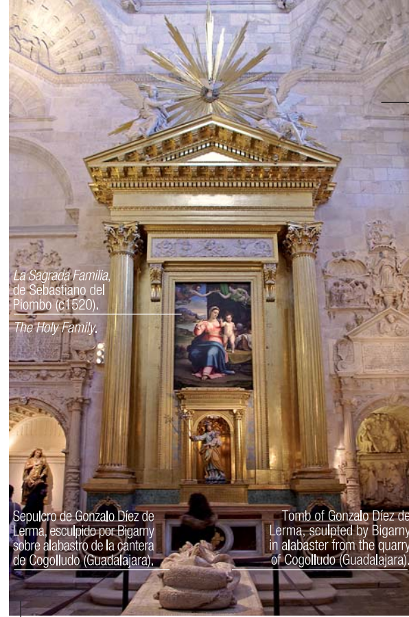
La Sagrada Familia, de Sebastiano del Piombo (c1520).

Actualmente el retablo de la iglesia de Santa Eulalia en Cardedeña tiene un ensamblado deficiente e inestable, con estructura y esculturas afectadas por hongos y carcoma que han llegado a desprender fragmentos. A pesar de que su restauración pueda ser compleja, consideramos que es un proyecto que debe llevarse a cabo. Así, las generaciones futuras podrán disfrutar de esta joya en el Camino de Santiago.