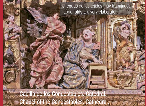
pliegues de los tejidos muy trabajados fabric folds are very elaborate